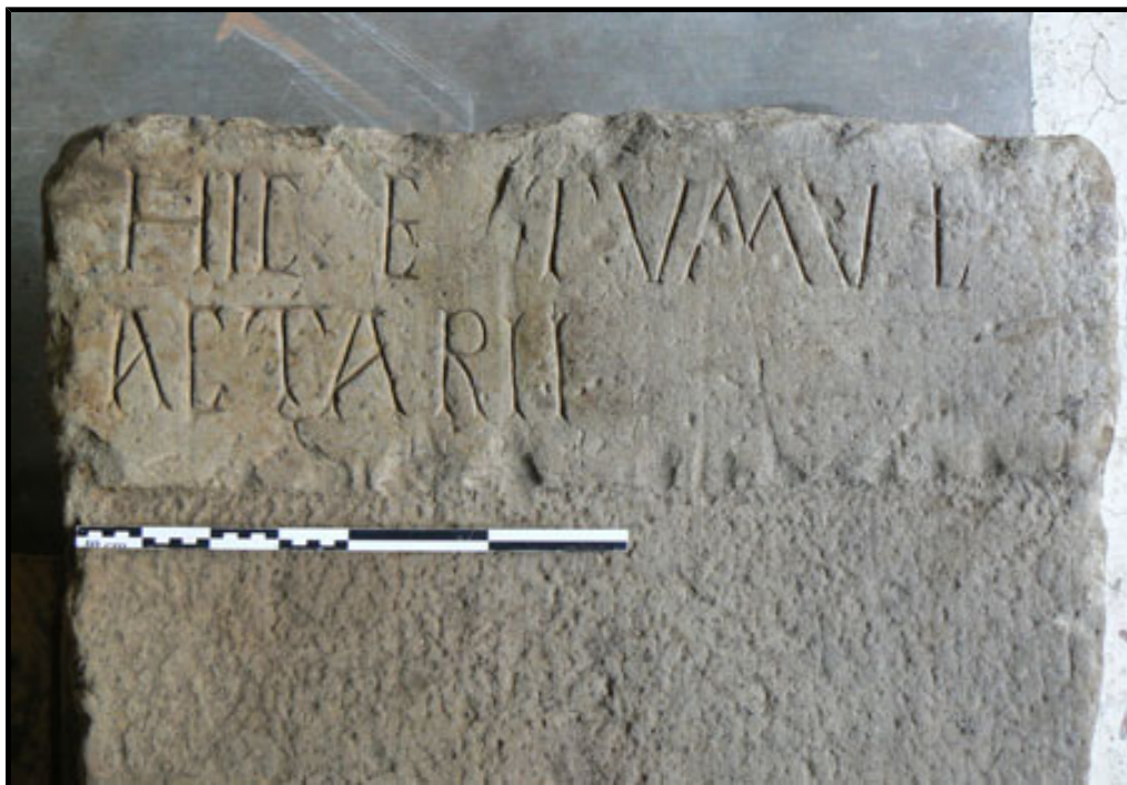
Fig. 1. Détail de l'épitaphe d'Actarius.