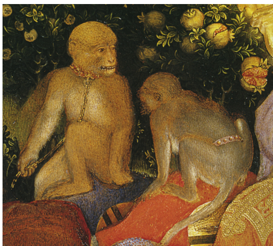
GENTILE DA FABRIANO, Adoration des Mages (détail du cortège avec deux singes portant laisse et collier) 1423.

Autre animal ayant à la fois le statut d'animal de compagnie et de bête sauvage gardée en cage : le singe 46 . Magots, macaques et cercopithèques ont été importés très tôt en Europe ; Charlemagne en possédait et un document daté de l'an 960 atteste des droits de douane payés sur les singes à l'entrée de la ville d'Aoste 47 . Aux XII e et XIII e siècles, il devient l'animal de compagnie chéri des princes,