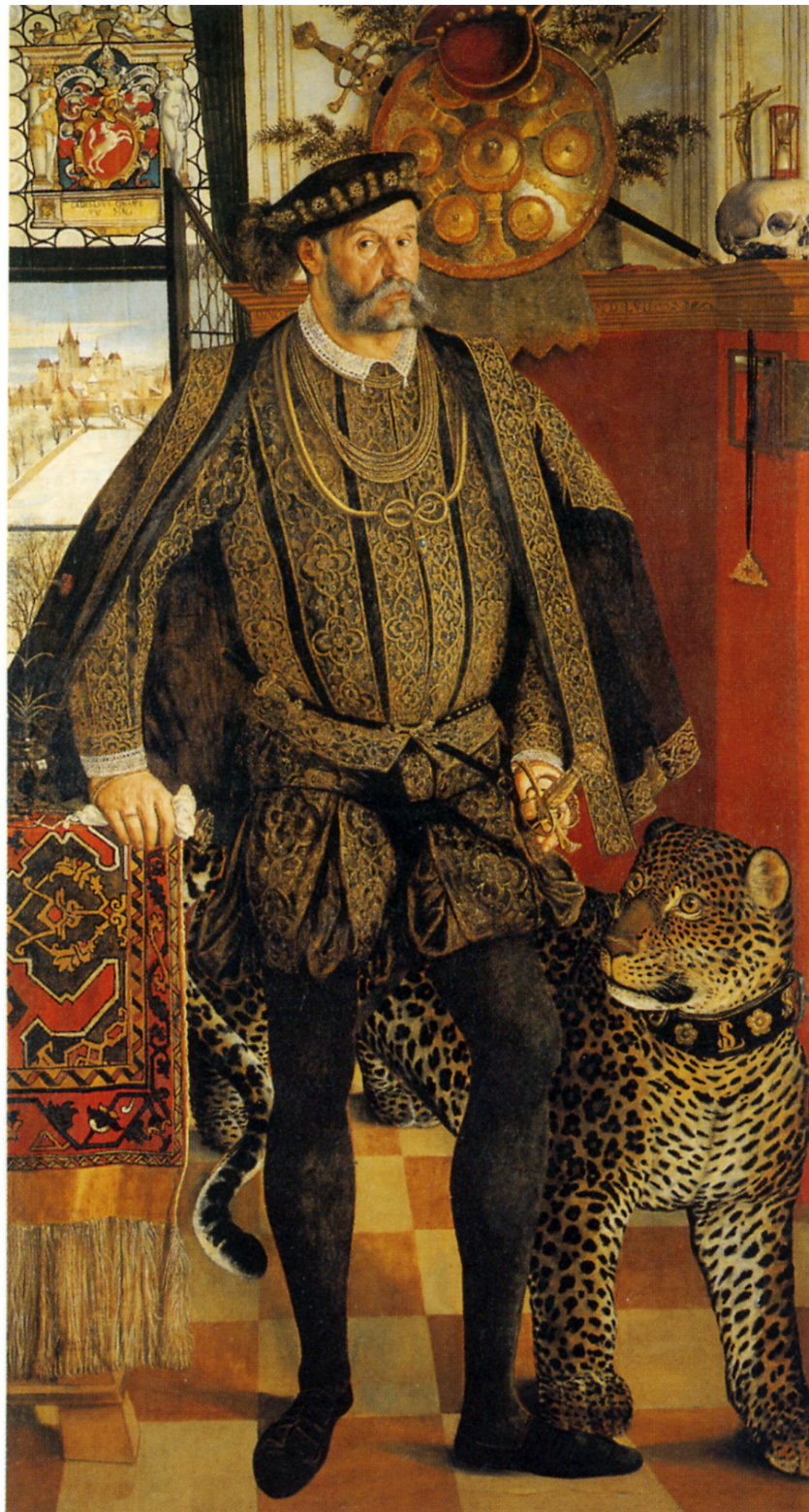
HANS MIELICH, Portrait de Ladislas von Fraunberg Huile sur toile. 1557.

Vaduz-Vienna (Liechtenstein), The Princely Collections, inv. GE 1065.