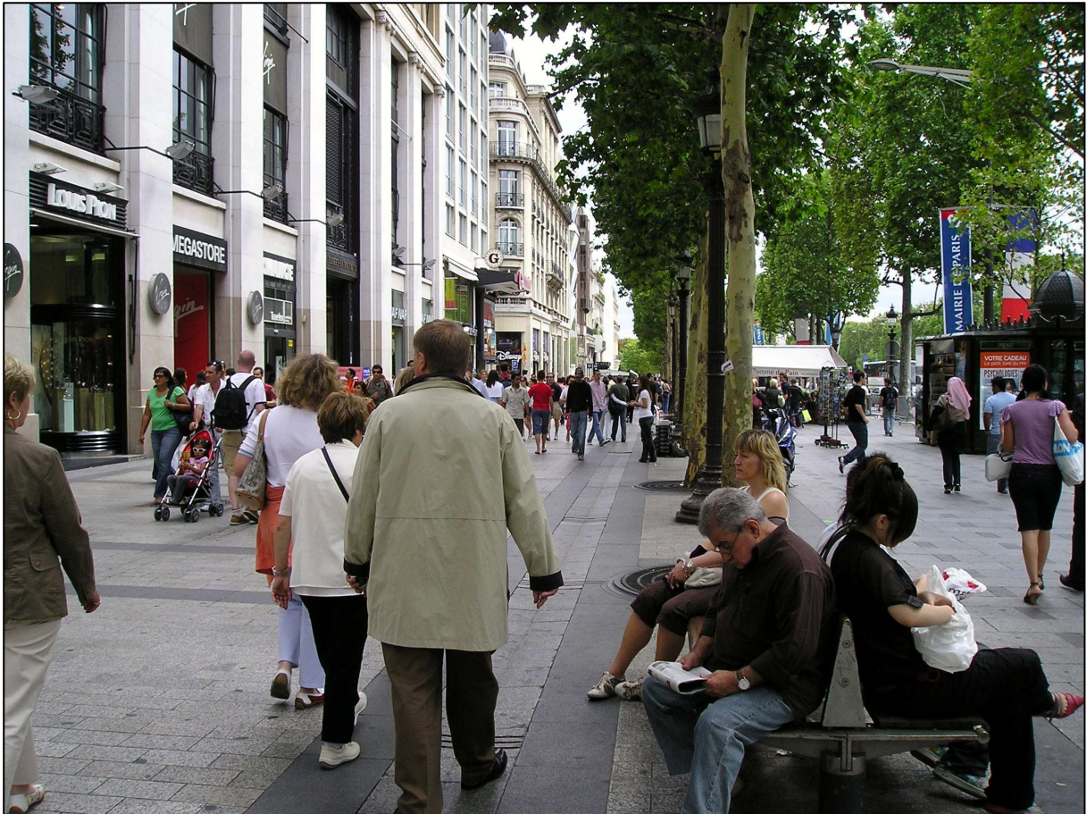
Figure 1. L'avenue des Champs-Élysées : une « grande opération » des années 1990 à Paris