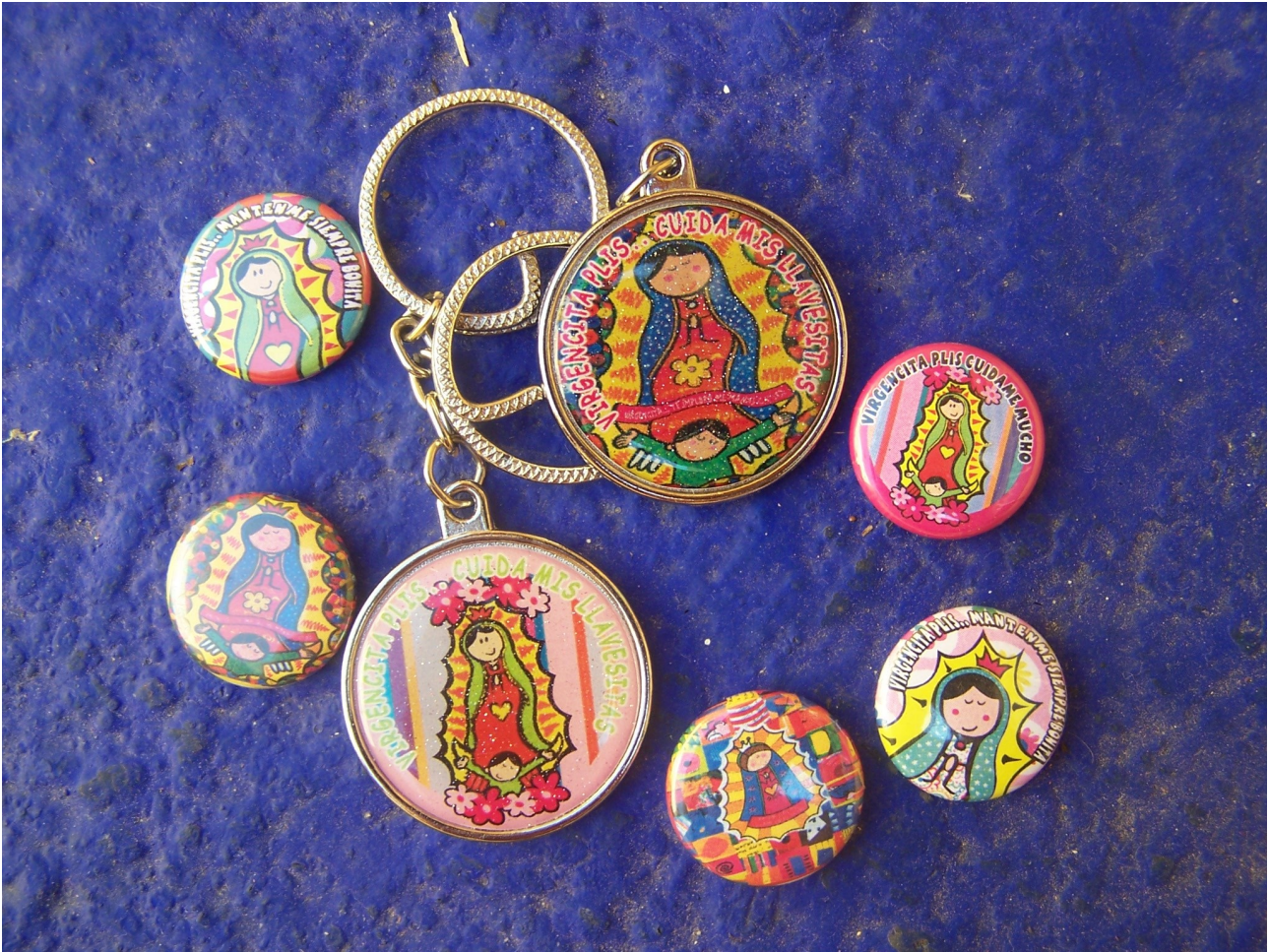
3. Portes-clés et badges de la « Virgencita » copiés sur la marque Distroller