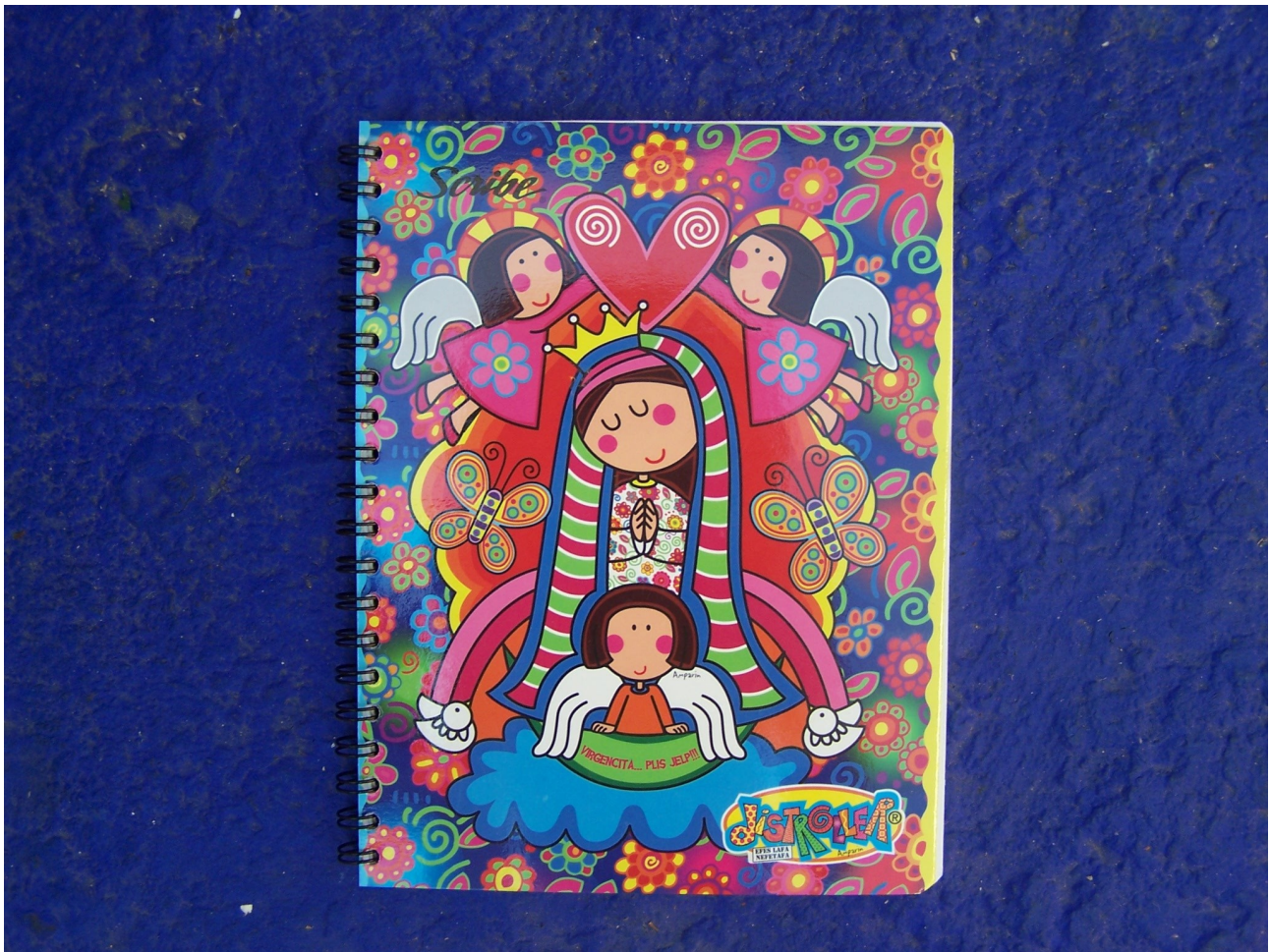
2. Cahier de la marque Distroller à l'effigie de la « Virgencita »