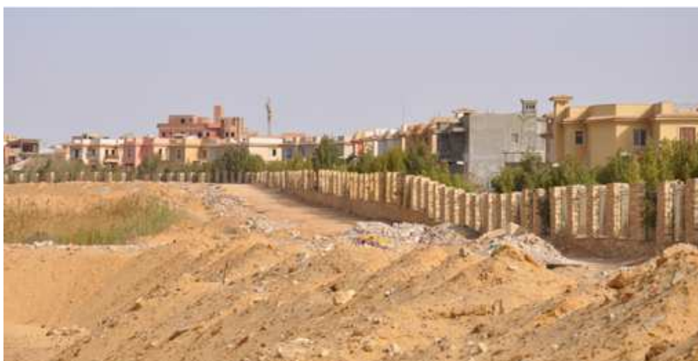
Figure 17. La fermeture « légère » du compound Al-Ashgar - Six Octobre