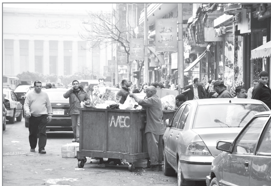
Figure 2– Une rue du centre-ville. Deux chiffonniers (l'un à l'extérieur de la benne, l'autre debout à l'intérieur en retrait du premier) cherchent des cartons ou des plastiques. La benne appartient à l'entreprise AAEC. Auteur : Pascal Garret, février 2010.

leurs territoires professionnels, les parcours varient en fonction du danger. Les façons de faire sont inégales et différencient ceux qui possèdent un pick-up , de ceux qui utilisent une charrette tirée par un âne ou de ceux qui sont à pied et qui sont dans une position encore plus vulnérable. De même, certains d'entre eux ont conclu des accords avec les commerçants ou avec les concierges d'immeubles qui gardent pour eux les déchets ; mais ces procédés ne concernent pas tous les zabbâln , loin s'en faut. A Manchiat Nasser, d'après l'un des responsables associatif, environ un quart des zabbâln – estimation difficile à vérifier – aurait totalement cessé le porte-à-porte et, sans territoire de collecte particulier, ramasserait dans la rue, dans les bennes et auprès des commerçants, exclusivement le carton et le plastique destinés au recyclage (entretien auprès du président de l'Association des collecteurs de déchets entretien, Manchiat Nasser, février 2010, BF).