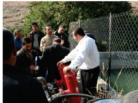
Formation d'agriculteurs du PFU à l'irrigation dans la région de Naplouse.

Etant donné l'absence d'une autorité politique palestinienne jusqu'en 1993, certaines organisations de développement se sont développées avec des agendas agricoles. C'est le cas du Palestinian Agricultural Relief Committee (PARC), émanant du parti du peuple palestinien (PPP, d'obédience communiste) qui est devenu après sa création en 1983 la structure puissante que l'on connaît (Abu Sada, 2007). Très implanté dans toutes les régions des territoires occupés, le PARC a créé le Palestinian Farmers Union (PFU) en 1992. En 2011, ce syndicat revendiquait environ 9000 agriculteurs, faisant de lui le plus grand syndicat agricole palestinien. Ses actions portent à la fois sur le plaidoyer interne (revendications envers l'Autorité palestinienne) et externe (notamment au travers de la « campagne populaire contre le mur et la colonisation ». Le PFU est également porteur de programmes de développement (amélioration de la production de l'huile d'olive, gestion de l'eau agricole, etc.). Toutefois, les critiques envers son président (autoritarisme, corruption) ont ébranlé le PFU dont il est difficile de dire si les effectifs sont stables.