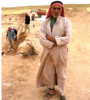
La Syrie de l'intérieur, avec ici des ouvriers agricoles

Pour autant, l'inféodation ou « l'incorporation » (Longuenesse, 1998) du grand syndicat agricole syrien au Baas n'a pas éloigné les agriculteurs de la révolte en cours puisqu'ils sont très présents dans la rébellion. En fait, le retrait de l'Etat dans l'agriculture, déjà entamé à la fin du règne d'Hafez el Assad puis accéléré avec l'arrivée au pouvoir de son fils Bachar en 2000 a révélé une déconsidération progressive du pouvoir pour un monde qui devenait moins pesant démographiquement même s'il représente aujourd'hui encore quelque 20% de la population. Evidemment, cette rupture d'un contrat social entre l'Etat et les paysans mériterait des travaux plus approfondis pour en vérifier l'intensité mais déjà des indices de crise rurale apparaissent bien à la veille de la révolution syrienne (Jaubert, Saadé, Haj Assad, Al-Dbiyat, 2013).