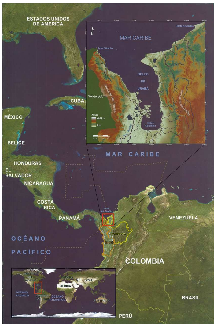
Mapa N° 1 Localización Región del Darién