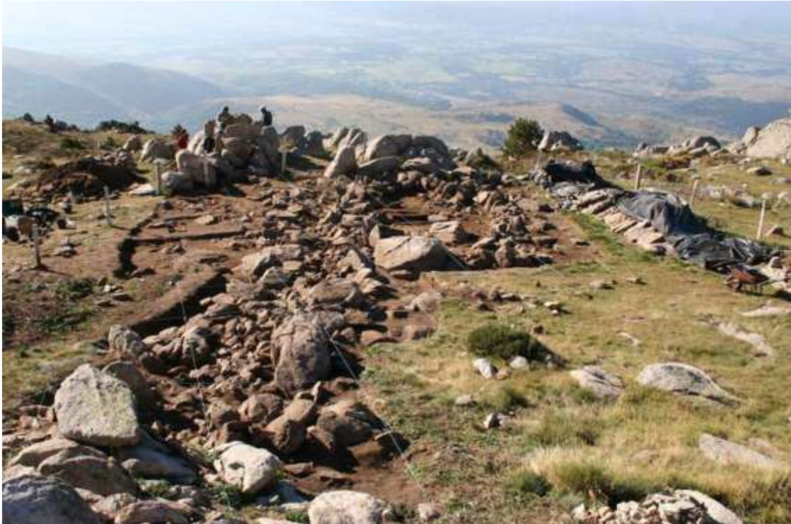
Figure 2 : L'habitat du site 88 avec à gauche le mur de ceinture.

La fouille, étendue sur 230 m 2 , a mis au jour un ensemble architectural inattendu, composé d'un habitat d'une surface totale de 40 m 2 , accolé à un mur de ceinture de près de trois mètres de large (fig. 2). Ce mur, d'orientation nord-sud, a été dégagé sur 25 m de long.