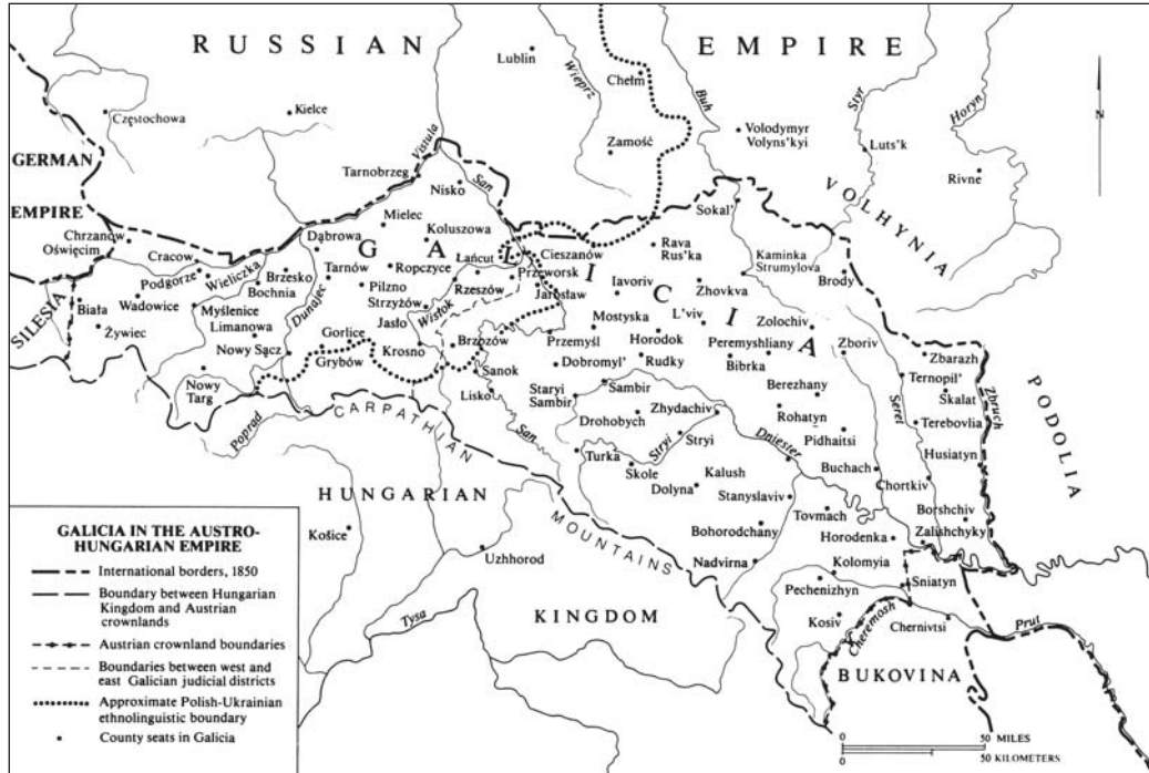
Fig. 1. — La Galicie austro-hongroise ( Morality and Reality , p. xvii).

pour les Polonais, ce qui explique que ce « piémont » galicien fut le creuset d'un nationalisme ukrainien ayant conçu dès 1848 un projet de séparation de la Galicie polonaise 4 .