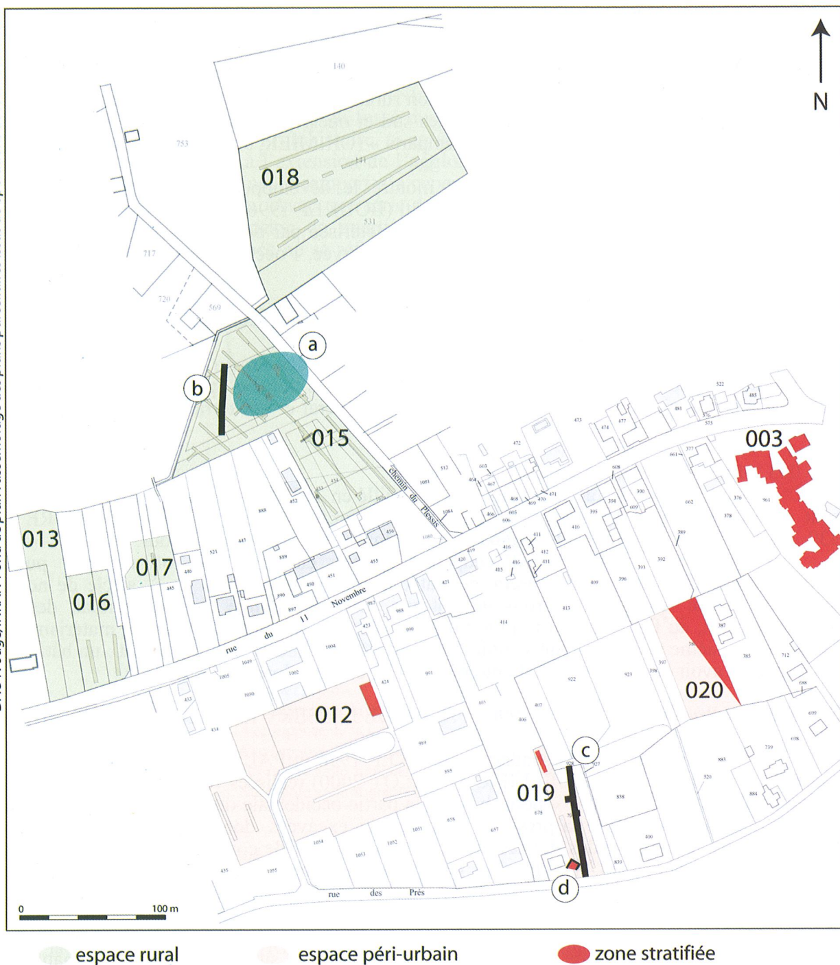
a. nécropole du Plessis ; b. fossé, limite de la nécropole ? ; c. fossé parcellaire ; d. bâtiment antique.