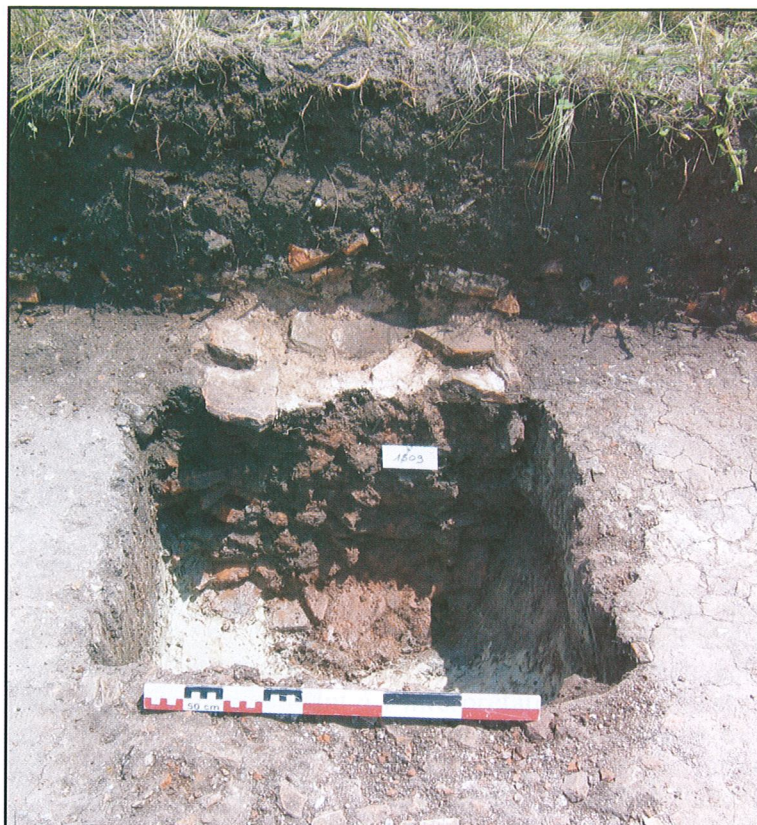
Fig.5 - Neung-sur-Beuvron. Site 020, rue du 11 novembre. Détail de la fondation du mur F14 (© J.-Ph. Chimier/Inrap).

Les limites de l'agglomération sont ainsi bien délimitées, la zone rurale est clairement définie. Avec deux types d'occupation de nature différente, la zone « périurbaine » est nettement distinguée du centre de l'agglomération dont la stratification conservée témoigne de la densité. Rien ne permet cependant de définir la nature de l'occupation « périurbaine » : jardins, espaces agropastoraux ou quartier urbain. La présence supposée de la voie de Blois permet d'envisager l'hypothèse d'un quartier d'habitat (?) organisé sur le même plan que ceux des « village-rues » récemment fouillés en région Centre.