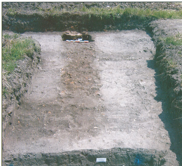
Fig. 4 - Neung-sur-Beuvron. Site 020, rue du 11 novembre. Vue générale de la fondation du mur F14.

L'agglomération proprement dite correspond à l'espace bâti dense, marqué par une stratification conservée, attestée par les observations anciennes et les fouilles récentes. Fugace en périphérie (sites 012 et 019), elle caractérise une partie du site 020 (« Rue du 11 novembre ») et accuse une puissance d'un mètre sur le site 003 (« Maison de retraite »). Sur ces deux derniers sites, la stratigraphie est phasée et permet de proposer plusieurs périodes sur le site 003. Les sondages réalisés sur le site 020 font reconnaître des constructions, des niveaux de sols (interprétés comme extérieurs) et du parcellaire sans qu'aucune organisation ne soit décelable. Les fondations des murs du bâtiment fouillés rue du 11 novembre montrent une technique de construction particulière. Il s'agit de tranchées quasi intégralement comblées avec de fragments de terres cuites architecturales. La surface de ce remblai est maçonnée : les assises de tuiles sont liées avec du mortier de tuileau. Cette technique de construction a déjà été mise en évidence ailleurs, sur le site 003 à Neung ou sur d'autres sites urbains comme à Tours (« Hôtel de Police » CHAMPAGNE, WITTMANN, YVERNAULT 2004 : 23). Elle est mise en œuvre pour drainer le sol sous les murs (fig 4, 5). Les fouilles de la Maison de retraite sont les seules réalisées sur l'agglomération. Elles sont a priori situées au cœur d'un îlot dont l'implantation au sein du schéma urbain n'a pas été reconnue.