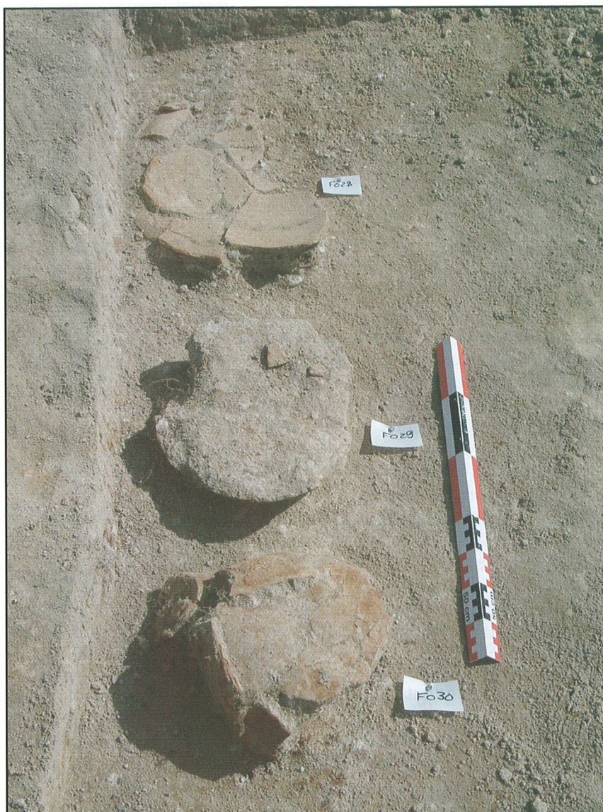
Fig. 6 - Neung-sur-Beuvron. Nécropole du « Chemin du Plessis », groupement de céramiques (F28, F29 et F30) (© J.-Ph. Chimier/Inrap).

Il semble que certaines céramiques puissent appartenir aux urnes cinéraires et les autres à des dépôts. La comparaison du gisement de Neung-sur-Beuvron avec la nécropole à incinérations gallo-romaines des « Mahis » fouillée dans la commune de Gy-en-Sologne (COUDERC et al. 2001 ; COUDERC 2006) et les deux crémations issues du site du « Grand Saulé » dans la même commune (JOLY 2002) montre une similitude entre les formes de céramique représentées (cruches, amphores, jattes tripodes) et leur association en contexte funéraire. Récipients cinéraires proprement dits, les cruches sont tronquées, de manière quasi-systématique ; aux « Mahis », il s'agit de vases réutilisés. Les autres formes, dont une partie sont des vases cassés avant enfouissement, proviennent d'offrandes. Des exemples de cruches tronquées réutilisées comme urnes sont aussi attestés à Baugy-Alléans (Cher, FONTVIELLE 1987 : 130). Cette pratique est aussi avérée pour le reste de la Gaule (exemples de Roanne -Loire, VAGINAY 1987 : 110 et de Vatteville-la-Rue - Seine-Maritime, LEQUOY 1987 : 58-59).