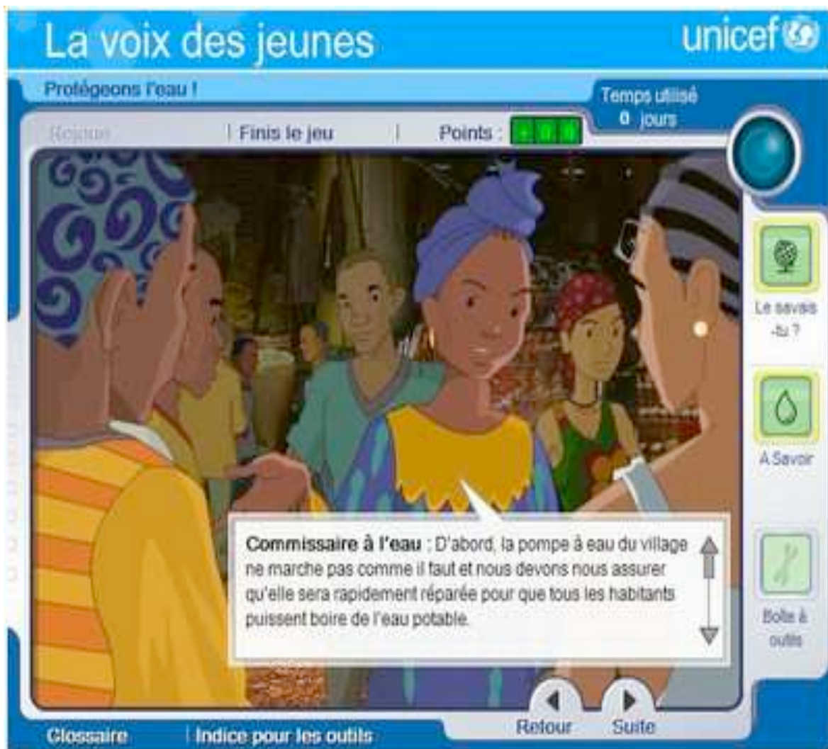
Figure 1 « Protégeons l'eau », Unicef http://www.unicef.org/voy/wes/

Après une longue période de sécheresse, ces orages risquent de provoquer des inondations et de favoriser la propagation des maladies liées à l'eau. Le jeu consiste à s'assurer que les habitants du village ont de l'eau potable, qu'ils vivent dans un environnement sûr et sain et que les enfants vont à l'école. Après une longue introduction qui explique ces éléments le joueur doit choisir sa mission :