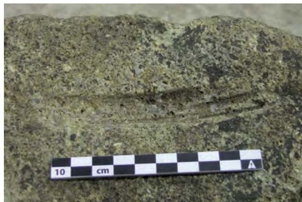
7. Bibracte, Mont Beuvray. Les matériaux de construction de la romanisation. Traces d'aiguisage sur un élément de colonne en grès (B995.21.1.62).

La détermination et la description des faciès pétrographiques montrent la grande diversité des roches employées pour le façonnage des éléments. Certains faciès sont privilégiés, tandis que d'autres ne sont que ponctuellement utilisés. Cette diversité est peut-être à mettre en relation avec la récupération d'objets particuliers qui ne seraient pas des meules finies et/ou usées, mais