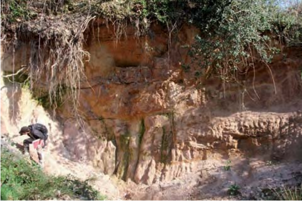
3. Bibracte, Mont Beuvray. Les matériaux de construction de la romanisation. Vue du front de taille de la carrière de Charconnet (commune de St-Léger-sous-Beuvray).

Saint-Légersous-Beuvray. L'affleurement visible correspond à du sable ayant une puissance stratigraphique d'environ quatre mètres (ill.3) et il repose directement sur le substrat qui est ici le granite rose à deux micas. Ce sable est ici ce que nous appelons une arène granitique, c'est-à-dire un sable grossier issu de l'altération sur place du granite qui constitue le substrat (Foucault, Raoult 2010). Cette couche sédimentaire détritique meuble doit donc posséder toutes les caractéristiques minéralogiques du granite rose à deux micas dont elle est issue. L'analyse de ce sable (ill. 4) permet en effet d'observer qu'il est constitué de quartz, de feldspaths, de grains de muscovite plurimillimétriques et de fragments de granite rose à deux micas. Les grains observés ont une taille qui varie du silt au gravier et ils sont sub-anguleux. Cette description est tout à fait semblable aux constituants grossiers présents dans les matériaux de types de pâte n° 5 et n° 8.