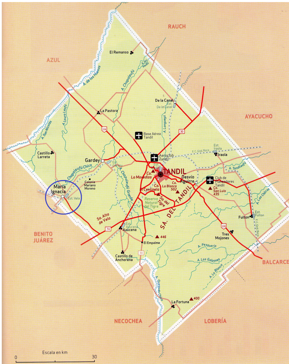
Carte 1 : Organisation du Partido de Tandil et indication du pueblo de Maria Ignacia (Vela)

[Collection : Actes Avignon - ISBN : 978-2-9105-4509-1]