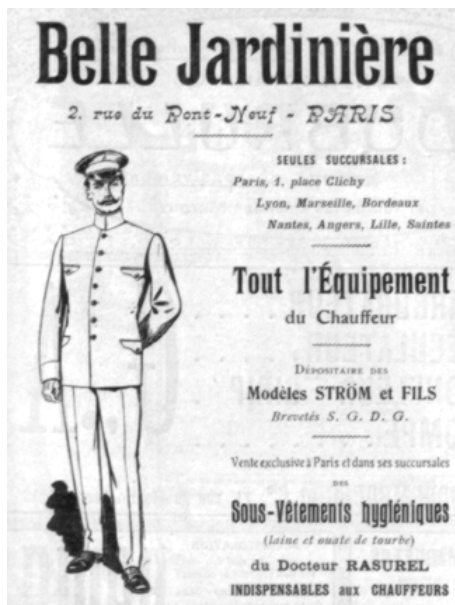
Image numéro 2. Les différents chauffeurs ne peuvent pas être confondus. Cette publicité non datée pour un magasin célèbre propose l'équipement du chauffeur qui ici est implicitement le chauffeur « de maître » et non celui qui conduit des véhicules industriels. Au volant, la tenue est aussi là pour marquer les différences.

ont présidé à l'édification de ces pans de l'identité des routiers : celui du code de la route et celui de la coordination des moyens de transport.