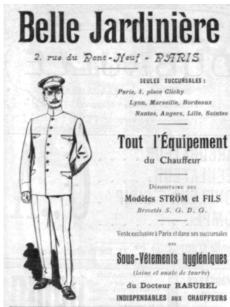
Image numéro 2. Les différents chauffeurs ne peuvent pas être confondus. Cette publicité non datée pour un magasin célèbre propose l'équipement du chauffeur qui ici est implicitement le chauffeur « de maître » et non celui qui conduit des véhicules industriels. Au volant, la tenue est aussi là pour marquer les différences.

ont présidé à l'édification de ces pans de l'identité des routiers : celui du code de la route et celui de la coordination des moyens de transport.