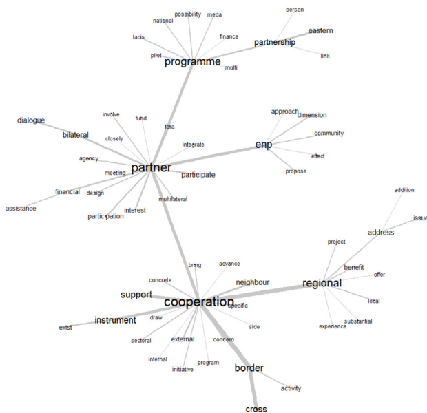
Figure 1. Univers lexical associés aux modalités de fonctionnement de la PEV

Le vocabulaire utilisé pour mettre en mots la politique de voisinage à intervalles de temps réguliers met en évidence des univers lexicaux qui se dessinent autour de notions-clés. L'analyse des communications-cadres de 2003 à 2013 révèle une grande diversité des mondes lexicaux en lien avec la désignation des entités spatiales. Plusieurs méthodes peuvent être utilisées pour étudier ces univers : fixer un objet spatial (région, nation) et interpréter son contexte d'utilisation, ou partir d'un des univers lexicaux qui émergent du corpus 3 et interpréter les proximités autour de notions qui paraissent pertinentes. Les graphes de similitude (figures 1 et 2) illustrent la configuration de deux mondes lexicaux associés, l'un autour des modalités de fonctionnement et d'action de la PEV (figure 1), l'autre autour des pays éligibles à la PEV (figure 2).