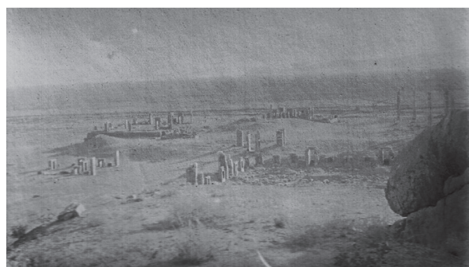
Fig. 1 – Vue générale de Persépolis en 1921.

Archaeological Survey of India : voir infra .