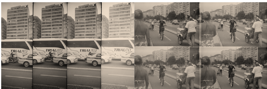
Figura 2 - fotos produzidas pelas autoras, com diferentes câmeras, na orla de Copacabana (no Rio de Janeiro, Brasil), em junho de 2012, durante pesquisa empírica