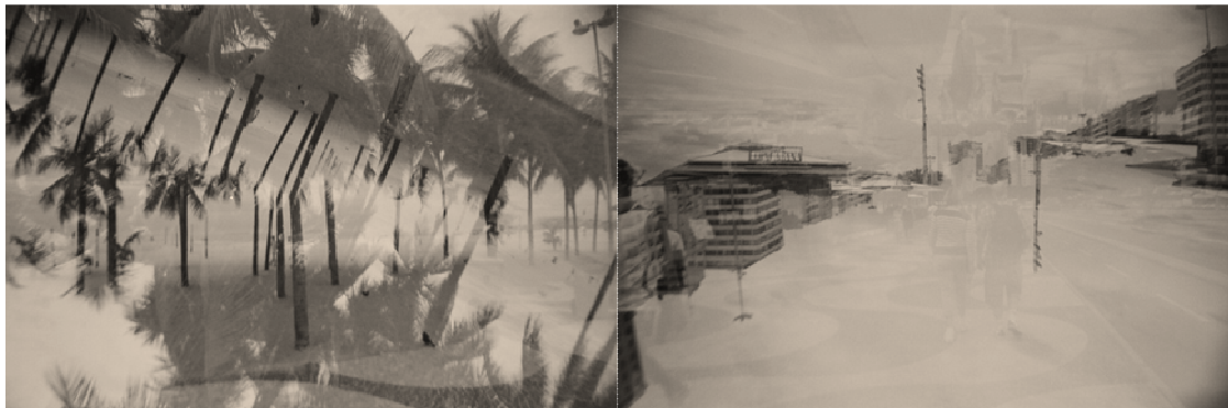
Figura 1 - fotos produzidas pelas autoras, com a câmera La Sardina, na orla de Copacabana (no Rio de Janeiro, Brasil), em junho de 2012, durante pesquisa empírica

Pudemos notar que ao sair em grupo na posse de câmeras fotográficas, os observadores creram que não pertencíamos à cidade. Vendedores acharam que éramos turistas e nos abordaram tentando vender produtos. Algumas pessoas nos olharam com curiosidade, já que as câmeras são um pouco diferentes das triviais – bem coloridas e com formatos peculiares. Enfim, essa experiência se diferenciou bastante da vivenciada até aquele dia, visto que, antes, as autoras figuravam como simples observadoras da ação.