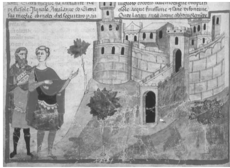
Fig. 1- BAV, Chigi L VIII 296, fol. 17v. Attalante et la fondation de Fiesole.