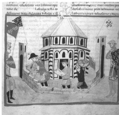
Fig. 8 - BAV, Chigi L VIII 296, fol. 44r. Reconstruction de Florence sous Charlemagne.