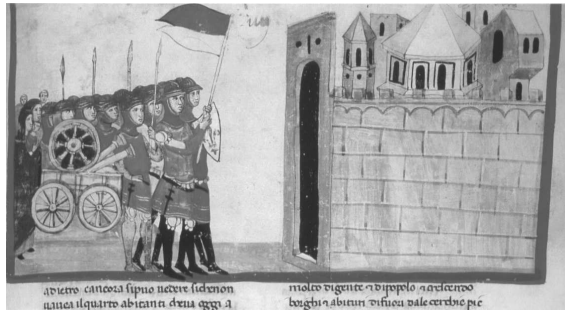
Fig. 3- BAV, Chigi L VIII 296, fol. 50r. Arrivée des Fiesolans à Florence.