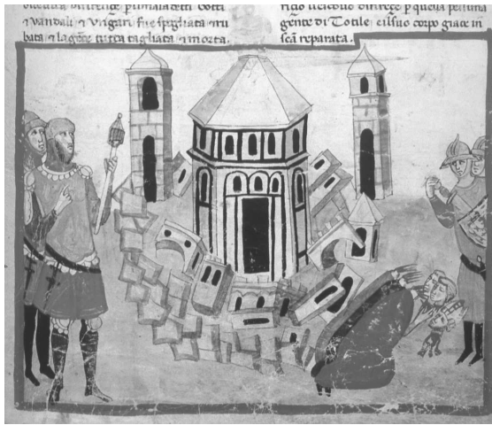
Fig. 7 - BAV, Chigi L VIII 296, fol. 36r. Florence sous Totila.