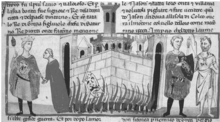
Fig. 4 - BAV, Chigi L VIII 296, fol. 18v. Première destruction de Troie.