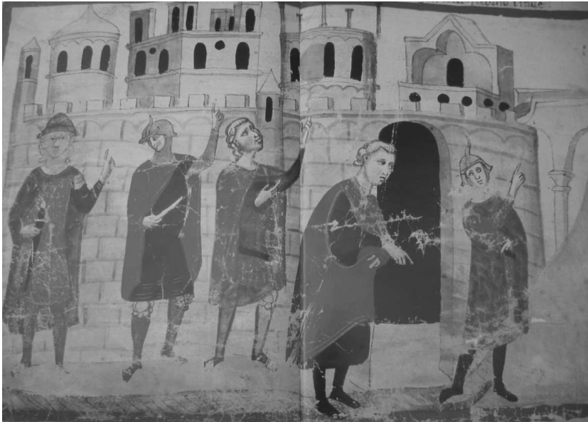
Fig. 6 - BAV, Chigi L VIII 296, fol. 27v. Les cinq fondateurs de Florence.