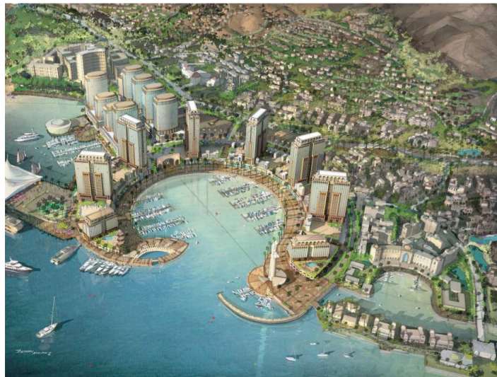
Figure 3: Le projet Marsa Zayed (2) – Aqaba

Cet urbanisme contraste totalement avec le reste de la ville, autant par son programme et ses destinataires, que par son architecture et son organisation urbaine. Saraya Aqaba apparaît comme une entité urbaine, en quelque sorte « déterritorialisée », issue d'un processus de fabrication de la ville ex-nihilo en rupture avec le tissu urbain existant. La forme urbaine et l'architecture mises en œuvre participent des valeurs et des images portées par ces actions urbaines et en deviennent symboliques. Le gigantisme, l'ostentation et l'opulence seront privilégiés à travers la forte verticalité des tours, une architecture singulière, signée par des « archi stars » et des espaces résidentiels d'exception caractérisés par l'horizontalité et un riche traitement paysager.