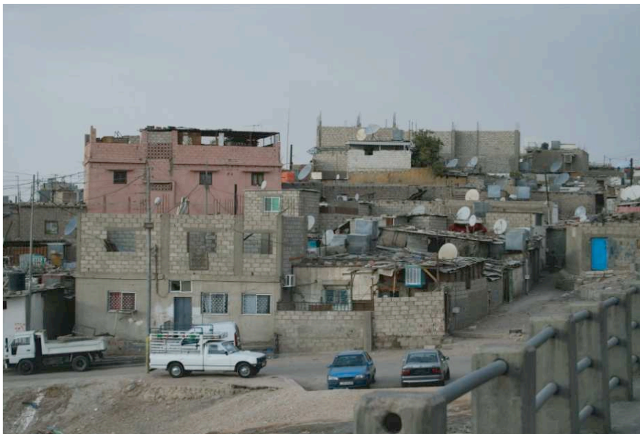
Figure 5: Le quartier de Shallaleh – Aqaba

Au regard de l'insalubrité de l'habitat dans ce quartier, les pouvoirs publics locaux n'ont pas eu de mal à justifier sa démolition, en mettant en avant l'objectif « (d') assainir le centre-ville, de lutter contre le trafic de drogues et le développement de la prostitution dont Shallaleh est l'un des foyers principaux 40 ». Cette opération a aussi été l'occasion pour l'A.S.E.Z.A. d'identifier et de contrôler les résidents actuels de ce camp informel de réfugiés palestiniens. Si le transfert de la population n'a pas fait naître de tensions sociales, cette stratégie de légitimation par la stigmatisation s'est heurtée, en revanche, au mécontentement et à la mobilisation d'environ une centaine d'habitants du quartier. Après avoir organisé une pétition, ils ont déposé une requête auprès des instances juridiques, afin d'obtenir réparation des préjudices.