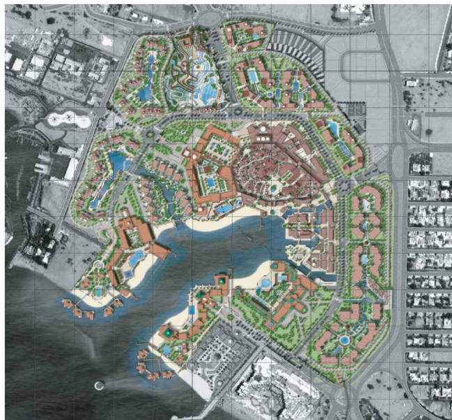
Figure 2 : Plan masse du projet Saraya Aqaba, (source : Saudi Oger)

Le complexe de Saraya Aqaba (fig. 2) mis en œuvre à la périphérie Ouest est une sorte de ville à part entière de 63,4 ha qui prolonge le front de mer aqabiote de plus d'un kilomètre. Il comprend un secteur hôtelier de haut standing (6 hôtels de 4 et 5 étoiles) développé autour d'un lagon artificiel connecté au golfe d'Aqaba ; un secteur résidentiel (appartements et villas) inscrit dans des espaces verts encadrant le complexe ; une reproduction de la vieille ville arabe, avec les attributs traditionnels, tels qu'un souk, des bains turcs et des hammams, des lieux touristiques modernes (restaurants, commerces, théâtre, musée, galerie d'art, centre de conférences et bureaux) et enfin un parc aquatique qui constitue un endroit potentiellement accessible par une clientèle non résidente.