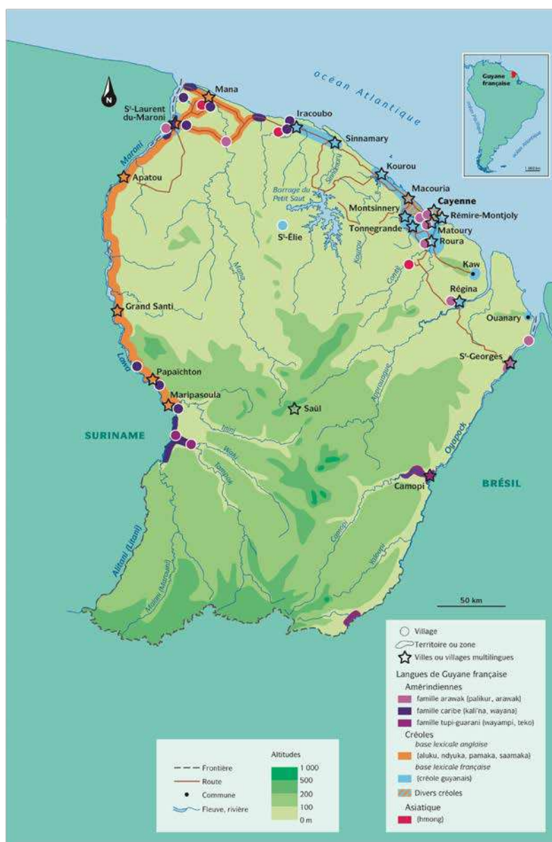
Carte 2 – Les langues de Guyane (Renault-Lescure & Goury, 2009 : 10)

2014, in NOCUS, I., VERNAUDON, J., PAIA, M., (dir.), Apprendre plusieurs langues, plusieurs langues pour apprendre : l'école plurilingue en Outre-mer , Presses Universitaires de Rennes, 101-124.