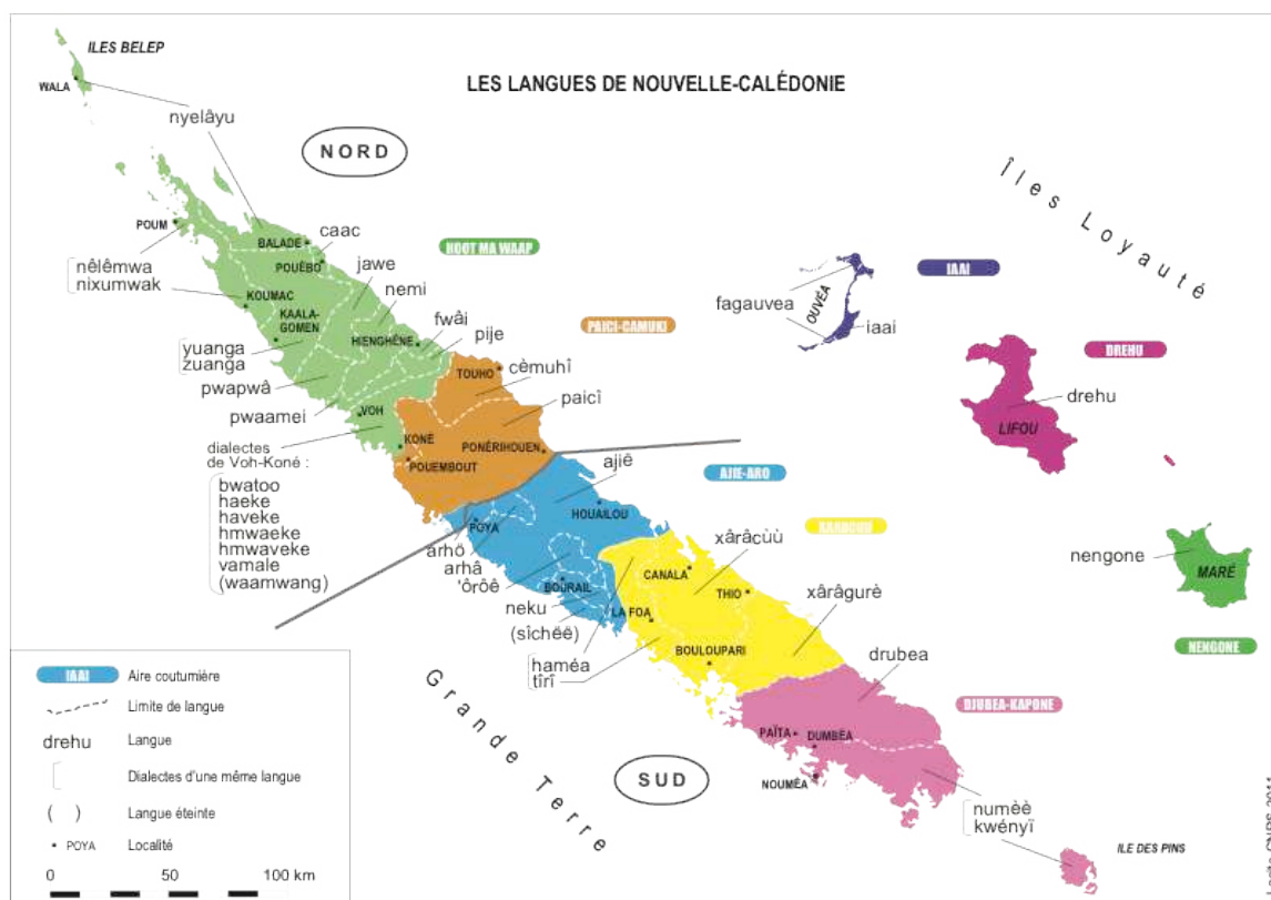
Carte 3 – Les langues kanak

À l'exception du fagauvea, les langues kanak (cf. carte 3) sont toutes issues d'une protolangue océanienne commune que les linguistes nomment le « proto-néo-calédonien » et qui correspond probablement à la langue parlée lors du premier peuplement de la Grande Terre et des îles Loyauté, il y a environ 3 000 ans (Sand & al., 2011). Le fagauvea, en revanche, a été introduit à Ouvéa, il y a quelques siècles, à la suite de migrations d'est en ouest provenant de diverses îles de Polynésie orientale, vraisemblablement Wallis, Samoa, Futuna et Tonga selon la tradition orale et l'étude comparative des langues polynésiennes (Moysse-Faurie, 2000).