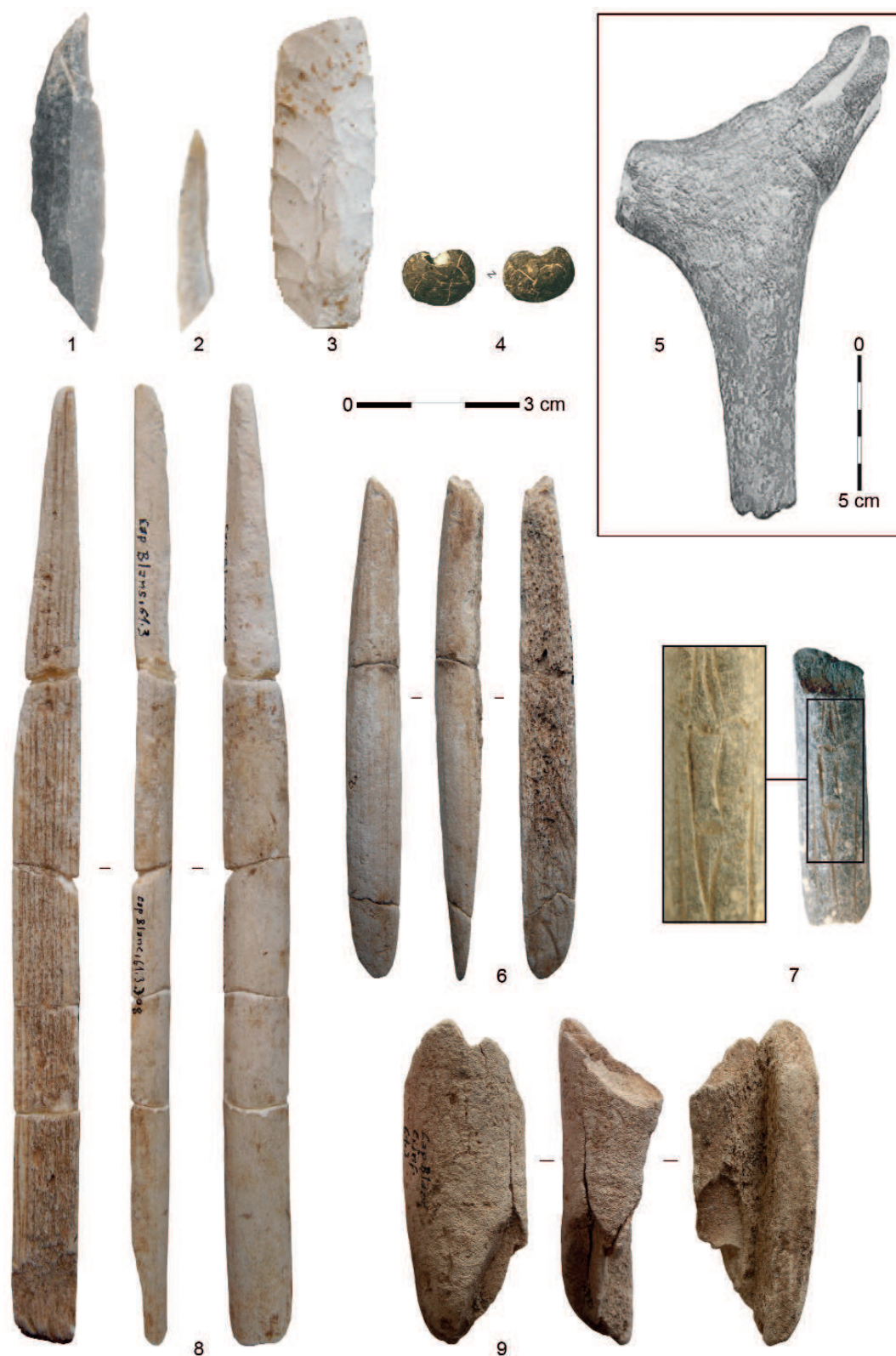
Figure 3 - Éléments diagnostiques des industries lithique et osseuse de Cap Blanc (collection Lalanne, Musée d'Aquitaine). 1 : bipoint azillienne ; 2 : lamelle scalène ; 3 : feuille de saule ; 4 : perle en lignite ; 5 : sculpture digitée en bois de renne ; 6 : pointe à biseau simple en bois de renne ; 7 : fragment d'objet sur baguette en bois de renne portant un motif en forme de bandeau étranglé ; 8 : baguette demi-ronde en bois de renne à biseau latéral ; 9 : éclat de bois de renne débité par percussion.