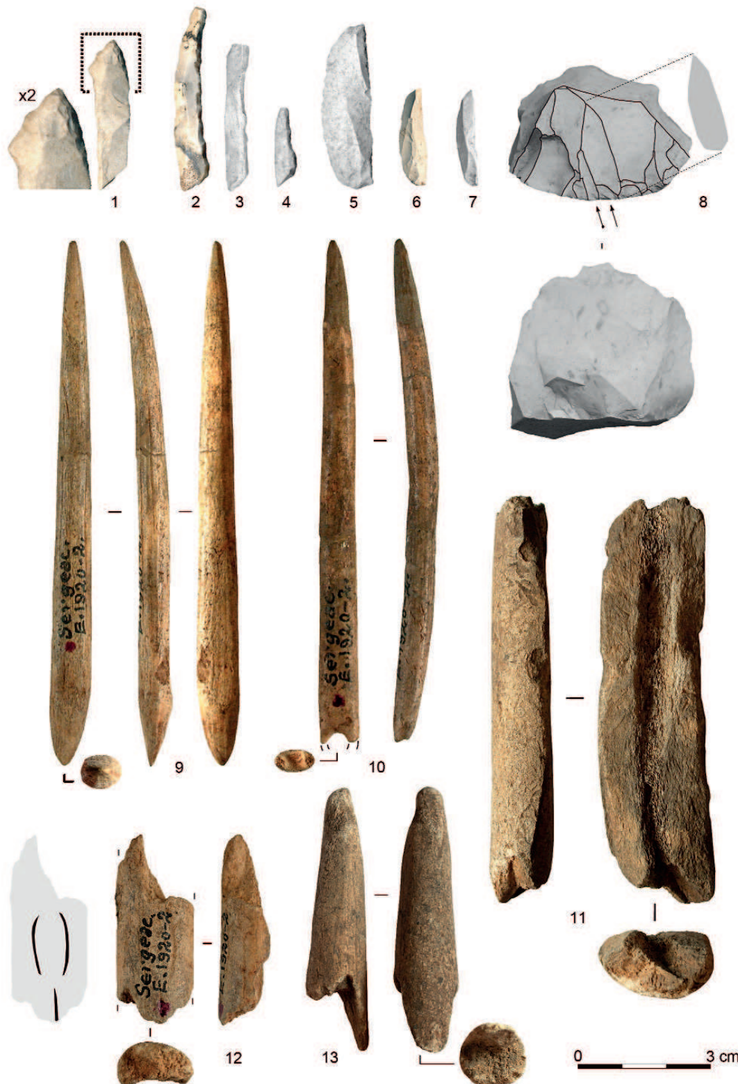
Figure 2 - Éléments diagnostiques des industries lithique et osseuse de Reverdit (collection Delage, IPH). 1 : pointe à cran et détail du cran ; 2 à 4 : lamelles scalènes ; 5 à 7 : lamelles courbes à retouche marginale ; 8 : nucléus sur lequel des lamelles courbes ont été détachées ; 9 : pointe à méplat mésial en bois de renne ; 10 : alêne en bois de renne ; 11 : hémi-tronçon de bois de renne débité par percussion ; 12 : fragment mésial d'objet sur baguette en bois de renne portant un motif en forme de parenthèses ; 13 : fragment méso-distal d'outil mousse en bois de renne sur support intermédiaire.