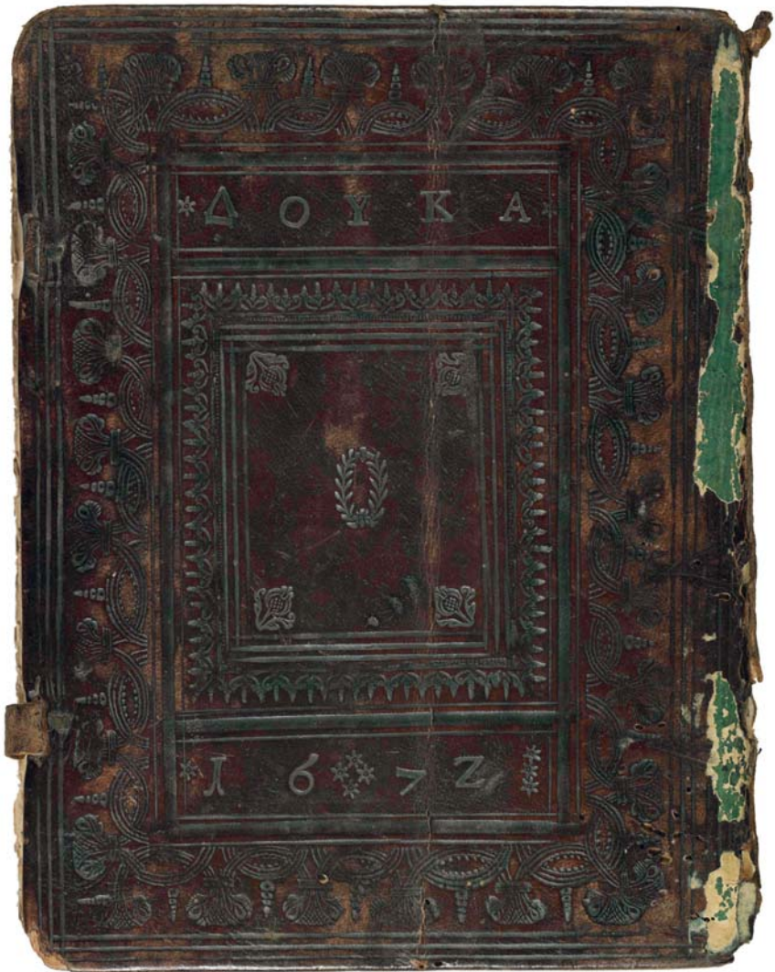
IFEB 33, plat inférieur, reliure au nom de Doukas, datée de 1672