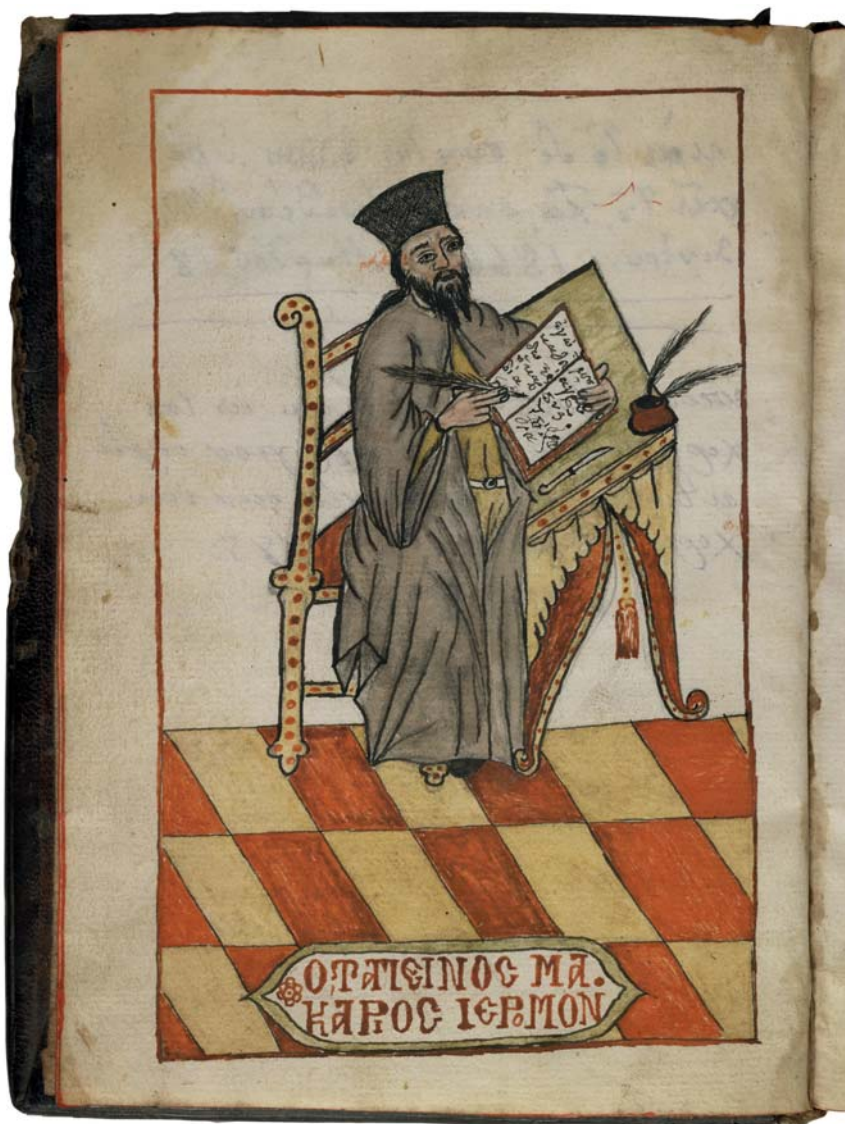
IFEB 49, f. IV v , copié par le hiéromoine Makarios Tamanès le 6 décembre 1798