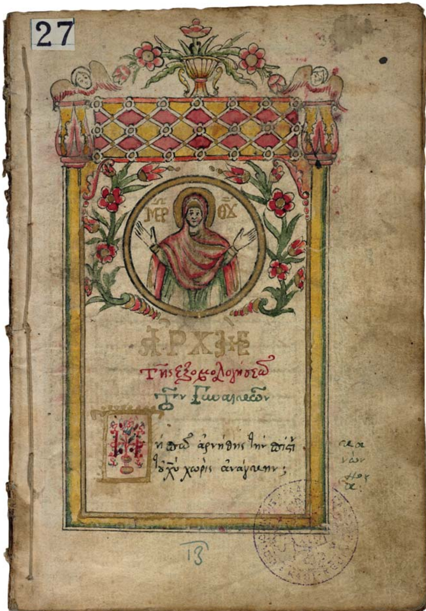
IFEB 27, f. 33, frontispice d'un Exomologètarion (dernier quart du 18 e s.)