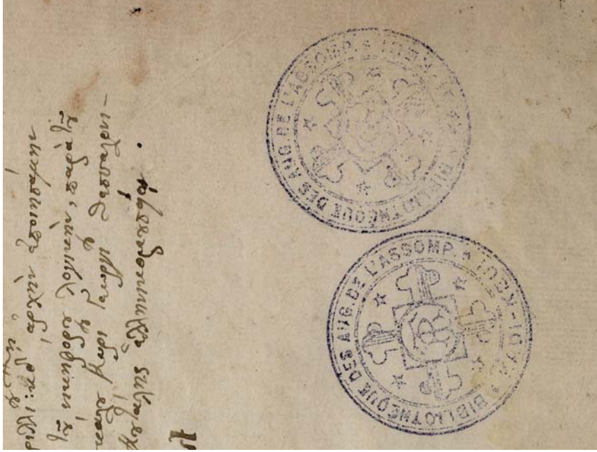
1b : IFEB 15, f. 1 (détail) Cachet des Assumptionnistes à Kadi-Keui