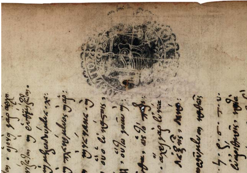
1a : IFEB 2, f. 1 (détail) Cachet du Phrontisterion de Trébizonde