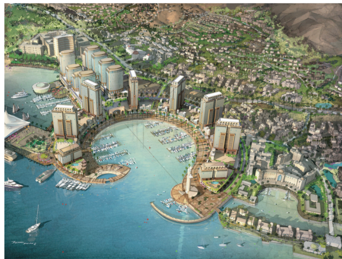
Figure 3: Le projet Marsa Zayed (2) – Aqaba

Cet urbanisme contraste totalement avec le reste de la ville, autant par son programme et ses destinataires, que par son architecture et son organisation urbaine. Saraya Aqaba apparaît comme une entité urbaine, en quelque sorte « déterritorialisée », issue d'un processus de fabrication de la ville ex-nihilo en rupture avec le tissu urbain existant. La forme urbaine et l'architecture mises en œuvre participent des valeurs et des images portées par ces actions urbaines et en deviennent symboliques. Le gigantisme, l'ostentation et l'opulence seront privilégiés à travers la forte verticalité des tours, une architecture singulière, signée par des « archi stars » et des espaces résidentiels d'exception caractérisés par l'horizontalité et un riche traitement paysager.