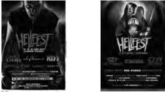
Les affiches 2010 et 2011 du festival Hellfest

Les références aux films d'horreur et à la mort sont explicites : “Le heavy metal s’attache dès le début des années 1970 à une iconographie heroic fantasy tirée du cinéma et de la bande dessinée. Ce qui va contribuer à accentuer sa dimension ésotérique, à souligner ses aspects virils et guerriers.”