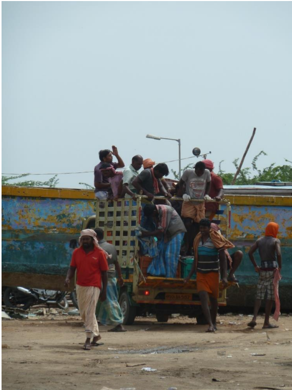
Figure 1 : Réfugiés Sri Lankais arrivant au port de Pondichéry

Après avoir brossé un rapide historique de la présence sri-lankaise au Tamil-Nadu, je montrerai de quelle manière ces espaces de l'entre-deux sont le produit à la fois du contrôle institutionnalisé des frontières et des initiatives et des pratiques des Sri Lankais qui développent des formes de cohabitations inédites. Avec leurs différentes manières de faire, de prendre place, les réfugiés sri-lankais créent dans ces espaces, leurs propres ressources, garantes d'une autre normalité. Pris dans une tension permanente entre formel et informel, reconnaissance et déni, les Sri Lankais modèlent des espaces – véritables interstices permettant leur intégration partielle – dans lesquels ils s'inscrivent dans des relations de pouvoir qui les placent dans un rapport de domination. Analyser ce type d'espace nécessite d'adopter un décentrement, épistémologique et situationnel qui consiste à déplacer le lieu et le moment du regard depuis le centre et l'ordre vers les bords et le désordre (Agier, 2012 : 53).