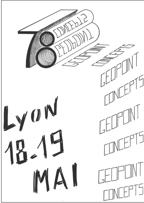
Fig. 3 – Annonce du colloque Géopoint dans le n° 2 des Brouillons Dupont (1978).