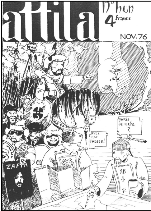
Fig. 1 – Page de couverture du premier (et unique) numéro de la revue d'étudiants Attila (1976) [Collection bibliothèque Épistémologie et histoire de la géographie, Paris].