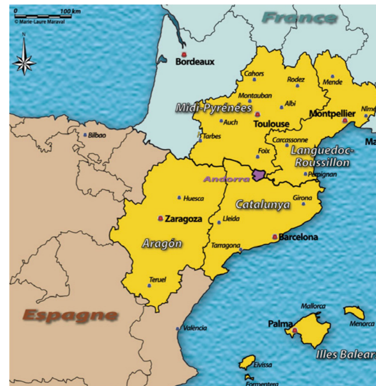
RYŚ. 4. Euroregion Pireneje-Morze Śródziemnomorskie