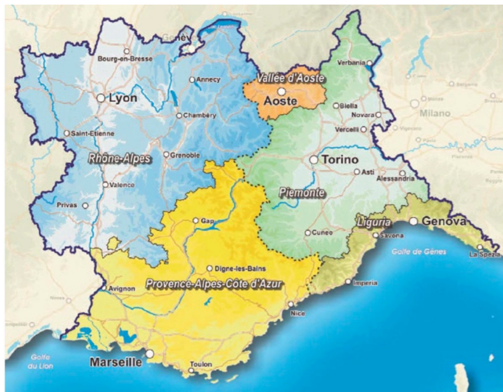
RYŚ. 3. Euroregion Alpy-Morze Śródziemnomorskie / ŹRÓDŁO: Marie-Laure Malaval, Uniwersytet Toulouse-Jean-Jaurès