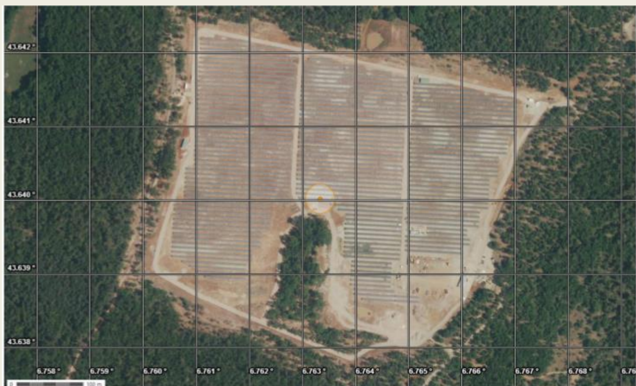
Chaque rectangle sur la centrale solaire représente 0,9 hectares