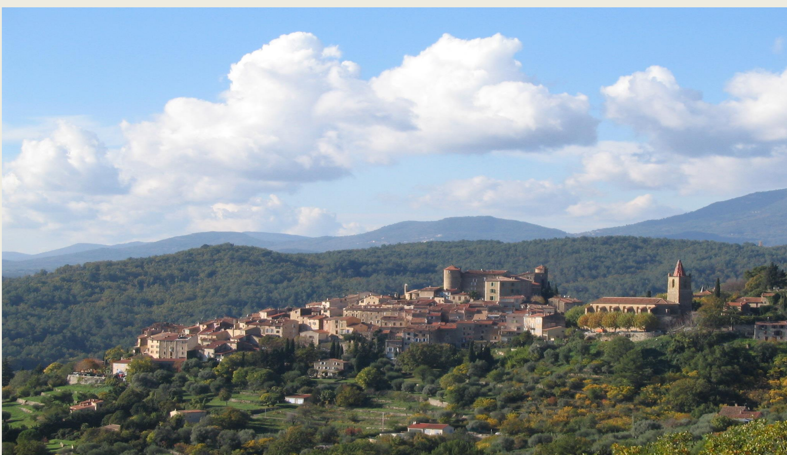
La centrale solaire (ci-dessous) est située à 2 km du centre de Callian (ci-dessus), sur la route qui monte dans la forêt.