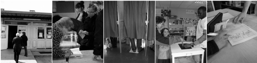
BUREAUX DE VOTE OFFICIEL ET EXPÉRIMENTAL, SAINT-ÉTIENNE, 22 AVRIL 2012