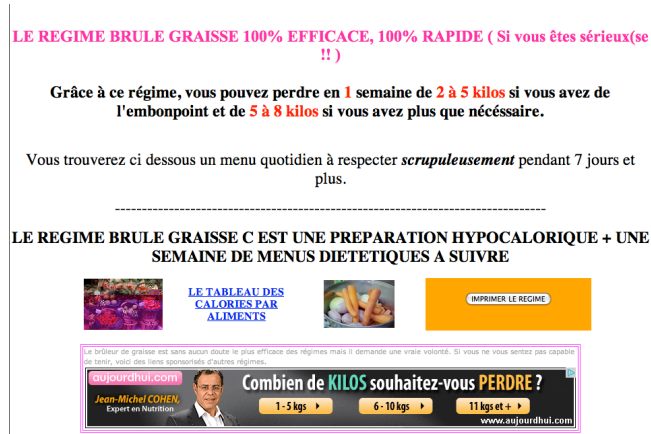
ill. 1 : http://www.vite-maigrir.com/solution_regime_nocod.htm

Rien d'étonnant, dès lors, à voir les nutritionnistes parler eux-mêmes de "tyrannie des régimes" 2 , alors que la circulation médiatique du discours sur les régimes est assurée par un certain nombre de relais : "De médecins spécialistes aux authentiques charlatans, de starlettes recherchant des revenus complémentaires ou pire, d'anciens gros avides de vengeance calorique : les régimes fleurissent" 3 . Ces régimes exercent d'autant mieux leur influence qu'ils reposent sur des régimes associés... de croyance, sous l'effet d'une rhétorique bien éprouvée.