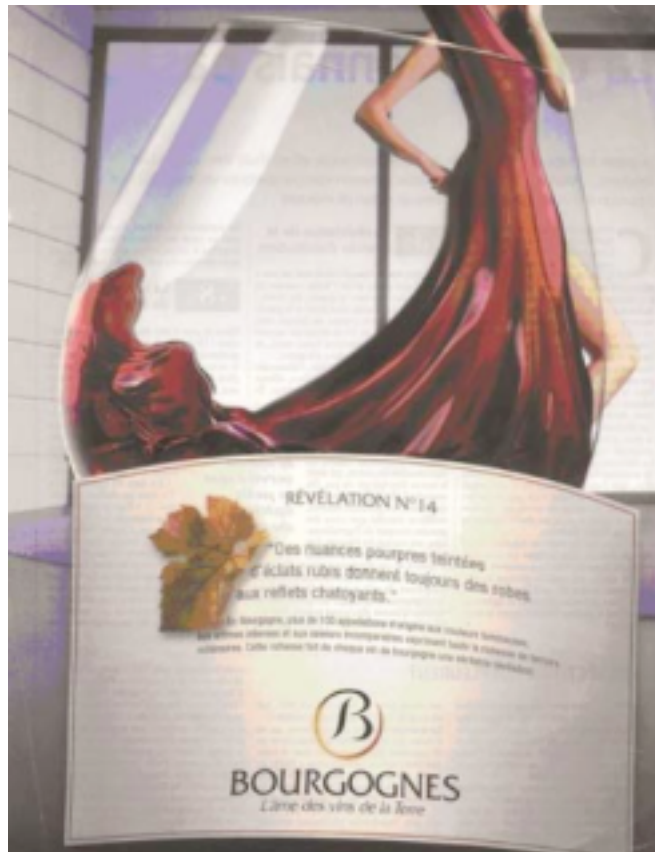
Ill. 1 (Bourgognes)

Une image qui redouble la topique, entre étiquette synecdochique et robe métaphorique, comme deux fragments ou empreintes d'une totalité, la bouteille, le vin, les Bourgognes. A charge, pour l'image, d'exprimer la substance du vin, sa densité, son caractère. L'arrêt sur image capte ici, et fige l'empreinte. Il fixe cette impression fugitive du goût, et plus encore de la saveur, comme la relation intime entre ce que l'on goûte et ce que l'on voit, ce syncrétisme permanent des modalités perceptives. Des lignes se forment, des formes se dessinent. La masse colorée se gonfle et se troue, par endroits, dans une infinité de veines et de plis, nés de ce mouvement. Sur un fond neutre, à la géométrie froide, ce qui n'est pas sans risque, s'il ne s'agissait d'anesthésier le cadre pour révéler au mieux la forme vivante. De l'image du vin à l'image du corps, nous voilà donc condamnés, avec le transport