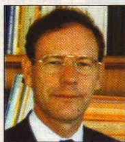
PAR GÉRARD FRANCIS DUMONT Professeur à la Sorbonne, président de Population et Avenir

La première donnée, souvent méconnue, est la différence dans les évolutions de la fécondité entre les États-Unis et l'Union européenne. On croit souvent que la chute de fécondité qui s'est étendue depuis les années 1970 à tous les peuples d'Europe, ainsi qu'au Japon et aux « Dragons asiatiques », inclut la population nord-américaine. Or, aux États-Unis, l'indice synthétique de fécondité, après diverses