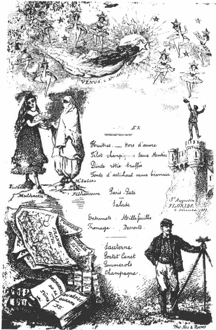
Figure 1: Cette figure montre les moments principaux de la carrière scientifique et militaire de François Perrier : on y reconnaît la jonction Espagne-Algérie (centre-gauche), le dessin de la nouvelle carte de France (bas), l'observation du passage de Vénus (haut et centre-droit). Il s'agit probablement du menu proposé lors de l'inauguration du Service géographique de l'armée.