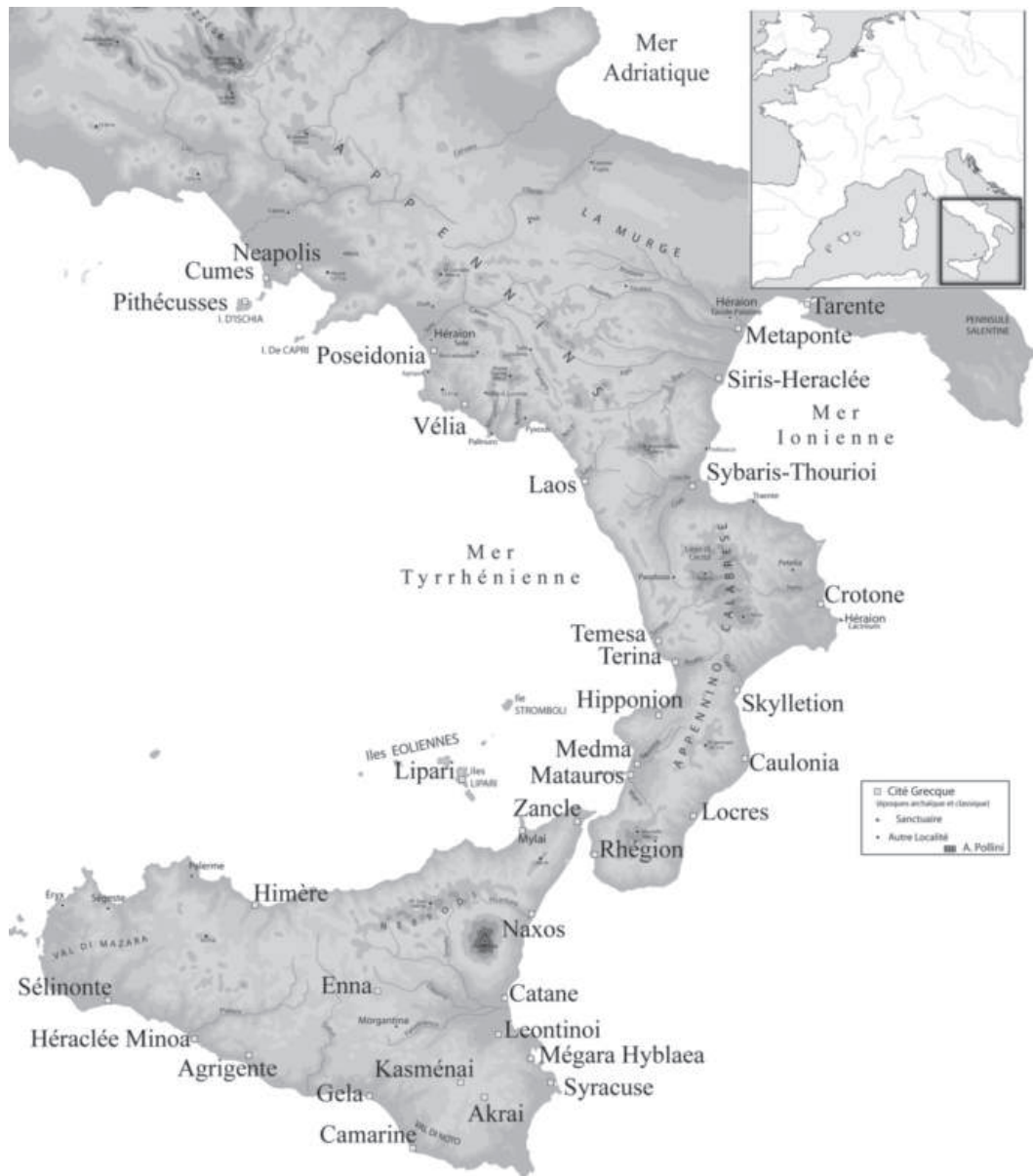
Fig. 1: Carte de la Grande Grèce et de la Sicile, avec l'indication des cités grecques coloniales. © Airton Pollini.