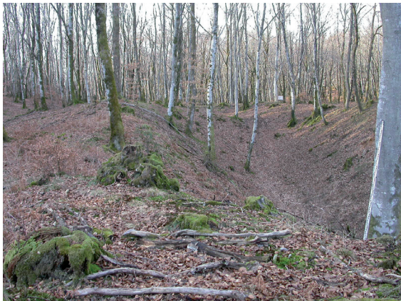
Mines de la Loutière, commune d'Ouroux-en-Morvan.

sur l'ensemble du Morvan, des études paléoenvironnementales ont été engagées. Celles-ci consistent en l'analyse conjointe de palynologie et de géochimie sur des séquences prélevées en tourbière. L'analyse des grains de pollen et des spores conservés dans la tourbe permet de suivre l'impact des activités métallurgiques sur le couvert végétal. En effet, les différentes phases du travail métallurgique, extraction, réduction, transformation, sont particulièrement consommatrices de bois et donc à l'origine de phases de déforestation perceptibles dans les enregistrements polliniques. Par ailleurs, les activités de réduction et de transformation du minerai ont émis dans l'atmosphère des micropolluants métalliques qui se sont ensuite redéposés au sol. Aujourd'hui, l'analyse géochimique des tourbes permet de retrouver ces traces et en particulier celles du plomb. L'analyse de la composition isotopique de ce dernier va permettre de différencier un plomb issu de l'érosion du substrat géologique de celui remobilisé lors des activités paléométallurgiques, et cela grâce à sa signature isotopique, issue du rapport de deux isotopes radiogéniques : ^{206}\text{Pb}/^{207}\text{Pb} . Cette signature fonctionne comme une véritable empreinte digitale et apporte une information quant à l'origine du plomb intégré au système. Présent dans de nombreuses minéralisations, le plomb permet de mettre en évidence une large gamme