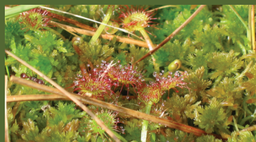
Végétation caractéristique des tourbières : sphaigne et droséra sur la tourbière du Port-des-Lamberts (photo I. Jouffroy-Bapicot).

Ces mousses caractéristiques des tourbières que sont les sphaignes piègent les grains de pollen émis dans l'atmosphère par la végétation environnante. Au cours du temps, l'accumulation des sphaignes va former la tourbe, au sein de laquelle les grains de pollen, « fossilisés » dans une ambiance humide et anaérobie, vont pouvoir être conservés pendant des milliers d'années.