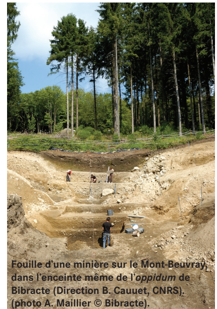
Fouille d'une minière sur le Mont-Beuvray, dans l'enceinte même de l'oppidum de Bibracte (Direction B. Cauuet, CNRS). (photo A. Maillier © Bibracte).

Trois carottes prélevées dans le massif du Morvan ont fait l'objet de ce protocole d'analyse. La première située au Port-des-Lamberts, sur la commune de Glux-en-Glenne (Nièvre), a été choisie parce qu'elle se situe à proximité du site de Bibracte, à environ 5 km à vol d'oiseau. La deuxième tourbière est localisée dans le même secteur géographique du Haut-Morvan, sur le massif du Grand-Montarnu, à quelques kilomètres seulement de celle du Port-des-Lamberts. La tourbière du Grand-Montarnu présente la particularité de s'inscrire dans un secteur très riche minéralogiquement, dans un lieu où des vestiges d'activités minières sont encore visibles. En l'absence de fouilles, la chronologie des exploitations antérieures au XIX e siècle reste aujourd'hui