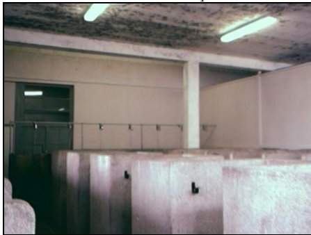
4 octobre 2005 : S. Fleuriet