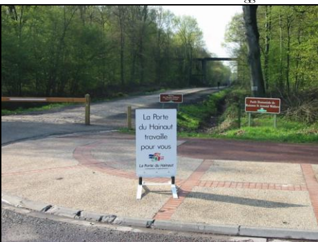
30 avril 2006 : S. Fleuriet