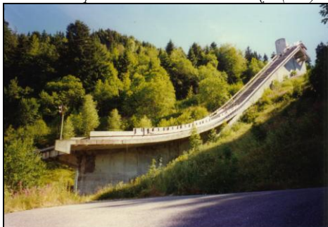
Août 1997. M. Raspaud