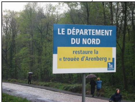
30 avril 2006 : S. Fleuriet