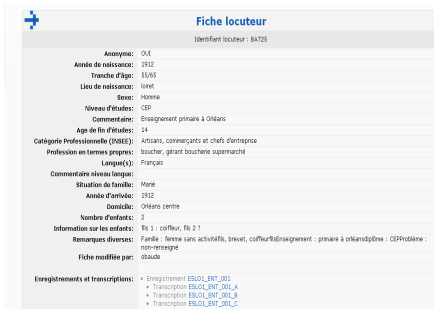
Figure 3. Fiche du locuteur de l'enregistrement 008

L'annotation effectuée automatiquement par CasSys reprend certaines informations contenues dans la base de données, comme l'année et le lieu de naissance, par exemple, mais, contrairement à celle-ci, l'information annotée pourrait être interrogée. L'annotation réalisée apporte des informations complémentaires non contenues dans la base de données comme celles sur les loisirs, les vacances ou encore la vie associative du locuteur. Ces informations sont parfois indiquées dans la base de données dans un champ « remarques diverses », mais d'une façon non systématique et ne permettant pas leur étude.