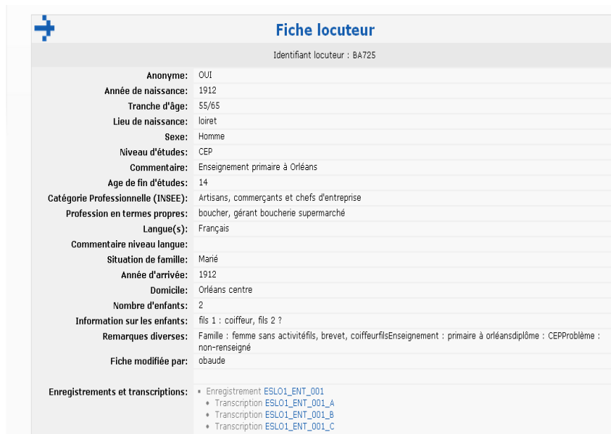
Figure 3. Fiche du locuteur de l'enregistrement 008

L'annotation effectuée automatiquement par CasSys reprend certaines informations contenues dans la base de données, comme l'année et le lieu de naissance, par exemple, mais, contrairement à celle-ci, l'information annotée pourrait être interrogée. L'annotation réalisée apporte des informations complémentaires non contenues dans la base de données comme celles sur les loisirs, les vacances ou encore la vie associative du locuteur. Ces informations sont parfois indiquées dans la base de données dans un champ « remarques diverses », mais d'une façon non systématique et ne permettant pas leur étude.