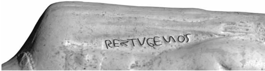
Fig. 2 - Signature du coroplaste REXTUGENOS, le long du bras gauche.

Enfin, le bras gauche enchâsse une inscription en relief suivant une graphie que l'on dira peu soignée, adaptée de l'alphabet latin : on remarquera en particulier les formes simplifiées du G et du S, ainsi que celle du N inversé 16 , que certains rapprocheraient de l'écriture lépontique 17 . On y lit le nom, connu par ailleurs, de REXTUGENOS, à la consonance encore gauloise (fig. 2).