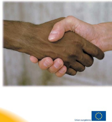
L'Union européenne et le monde La politique extérieure de l'Union européenne