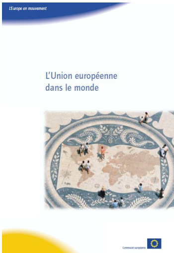
Un acteur mondial Les relations extérieures de l'Union européenne