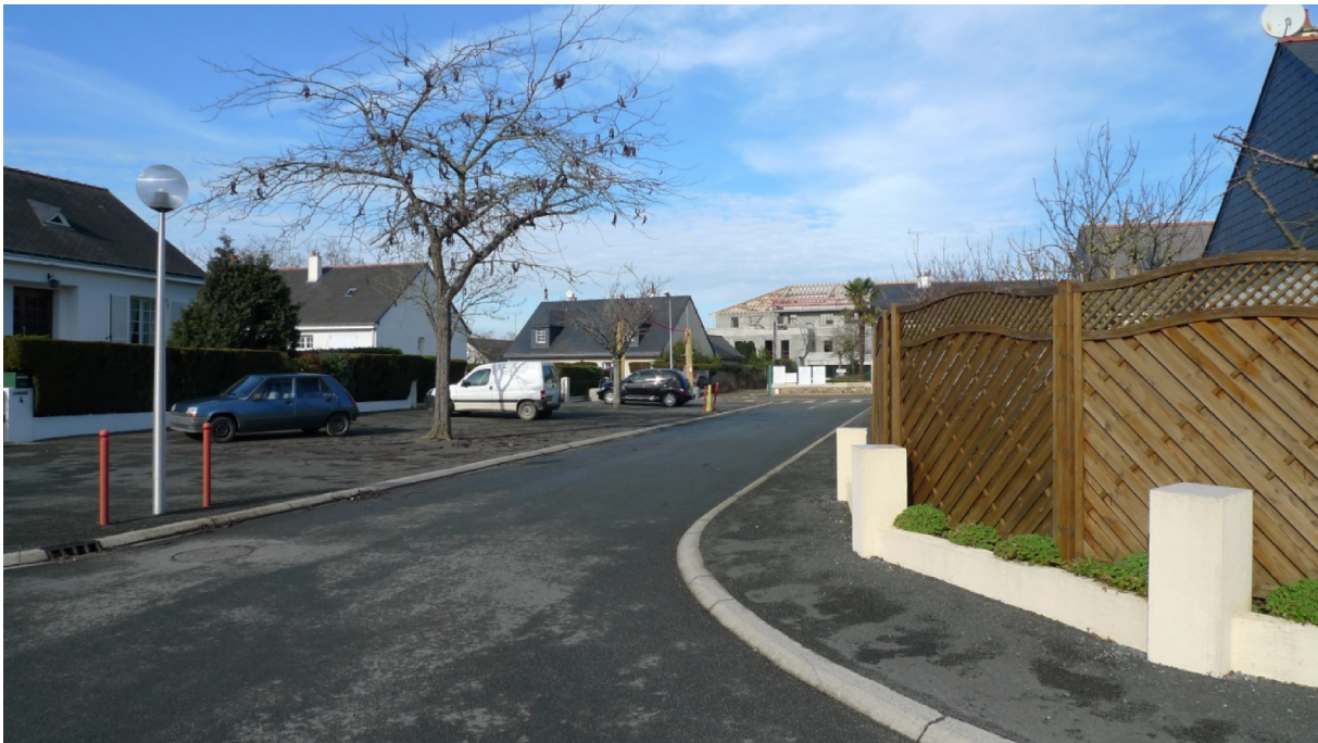
Une rue d'Avrillé près du boulevard réaménagé avec l'implantation d'un tramway. On note à l'arrière-plan une opération d'habitat collectif en cours de construction

Il existe ceci étant des procédures intermédiaires. Un exemple peut en être donné avec une opération d'aménagement d'un quartier pavillonnaire d'Avrillé, en banlieue d'Angers, étudiée par Annabelle Morel-Brochet 15 . Ce quartier s'est constitué à partir des années 1920 et ne compte que quelques immeubles collectifs (des logements sociaux pour l'essentiel). Initialement, le quartier jouxtait un aérodrome. Ce dernier a cessé son activité en 1998. La municipalité d'Avrillé s'est alors saisie de cette opportunité foncière pour lancer un projet d'éco-quartier comprenant 5 000 logements. En lien avec ce projet, la municipalité a décidé de requalifier en boulevard urbain la voie de circulation séparant le quartier pavillonnaire de l'éco-quartier. Cette requalification s'est accompagnée de l'implantation d'un tramway.