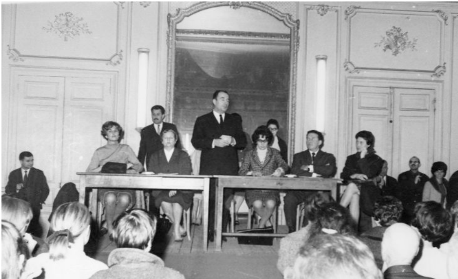
Réunion publique avec François Mitterrand et Yvette Roudy à Nevers en 1966, photographie noir et blanc, anonyme, Angers, CAF, © Yvette Roudy.