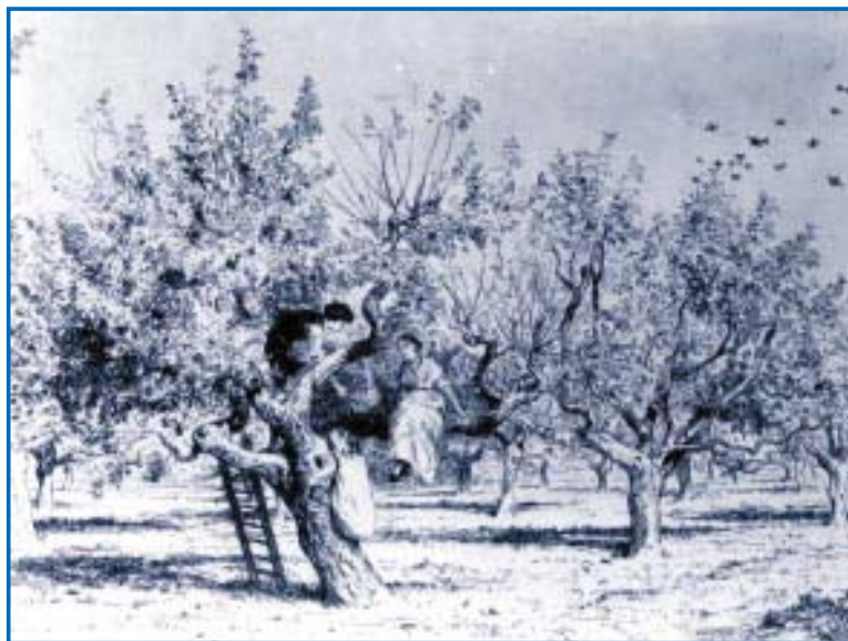
La cueillette in Mireille, Burnand, 1884. Exposition MNATP/BNF: Mireille. Le chef d'œuvre de Mistral dans l'histoire littéraire et dans son cadre provençal.

les fasse disparaître. A la fin du dix-neuvième siècle, Gaston Paris plaida pour une enquête qui concernerait toutes les communes du territoire français afin de relever les variations géographiques, supposées fort nombreuses, mais surtout dans le but de recueillir des informations sur le contact des patois avec le français et d'accéder ainsi à une meilleure connaissance de celui-ci. Au même moment l'avancée tech-