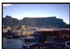
Figure 2. Victoria and Albert Waterfront (site et extérieurs)

Installé dans un port toujours actif, proche du centre ville et de ses flux, facilement accessible par les transports en commun, le V&A Waterfront est un morceau de territoire de plus en plus ouvert : à la ville, puisque les constructions les plus récentes comblent les vides urbains ; au paysage, puisque le mall juxtapose lieux ouverts et lieux fermés ; à un public divers ; au monde, puisque 25 % environ des visiteurs sont des touristes étrangers.