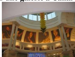
Figure 7. Intérieur d'une galerie à Canal Walk (Century City)

Canal Walk à Century City regorge de références à l'Italie, à la France et à l'ensemble des pays méditerranéens, symbole de lieu proche du paradis. Le centre est fortement inspiré d'exemples étrangers et là aussi, l'Afrique du Nord est présente avec les deux grandes portes en forme de pyramide et la double tête de Sphinx qui accueillent les visiteurs. Les galeries et allées intérieures prennent parfois l'allure d'un musée (Figure 8).