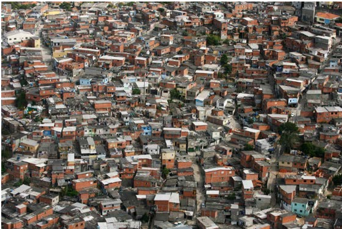
Photo 5 Favela de São Paulo