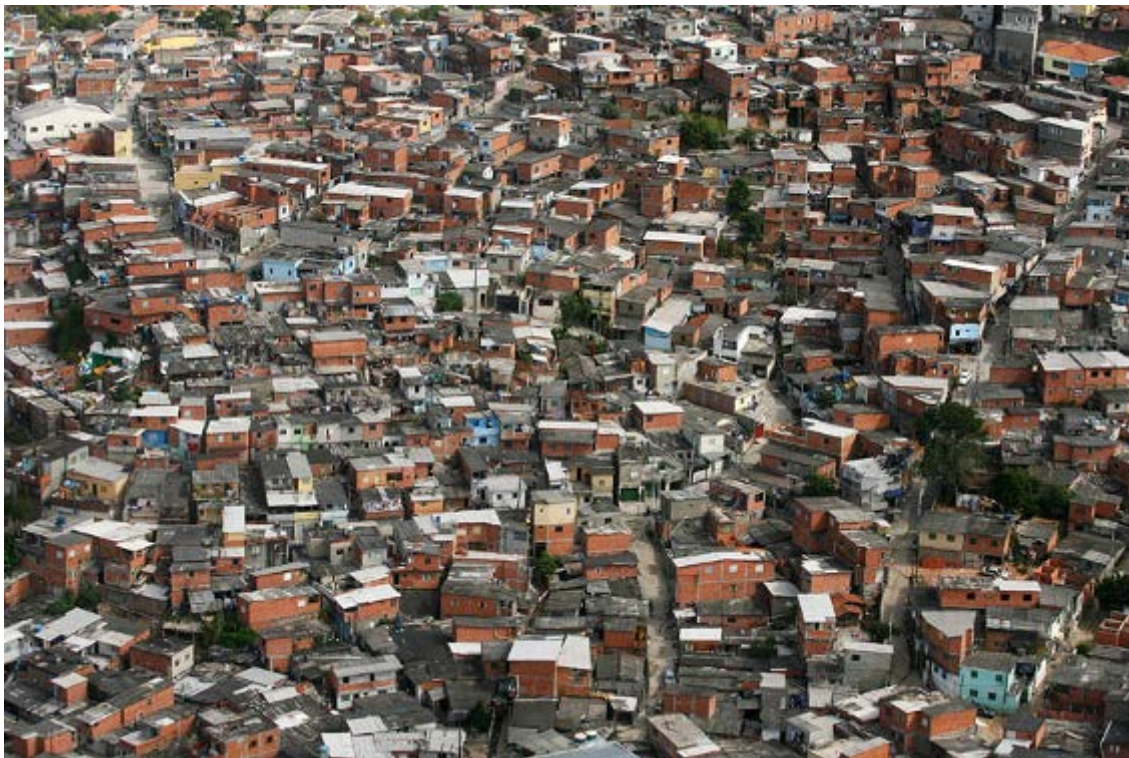
Photo 5 Favela de São Paulo