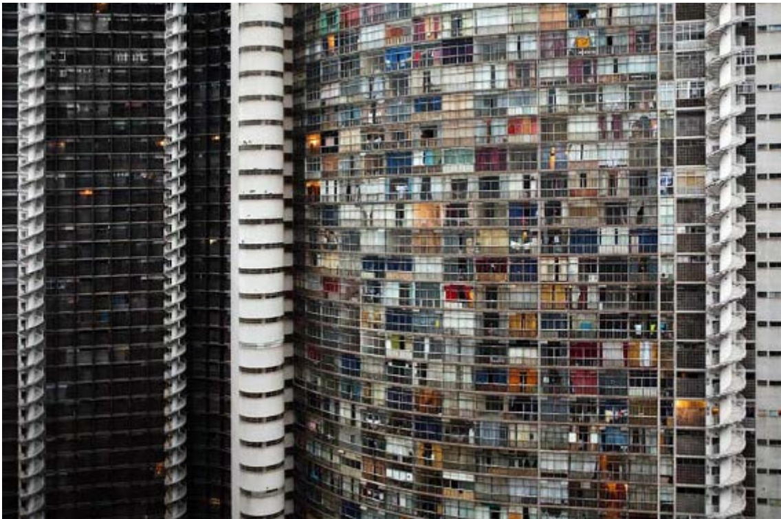
Photo 7 Immeuble du centre de São Paulo