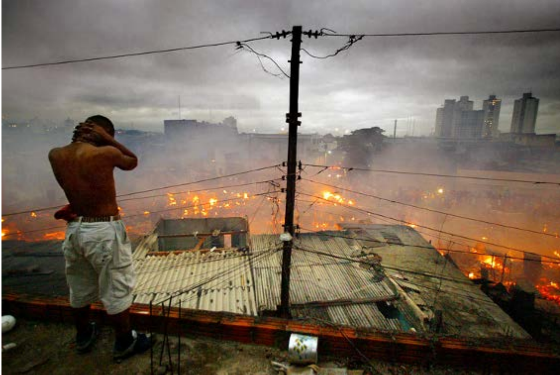
Photo 8 Incendie de favela à São Paulo