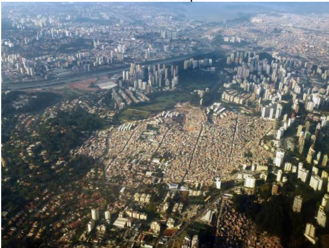
Photo 2 Paraisópolis

Profitons à notre tour de l'anecdote pour pousser la réflexion. La photo a été prise à Paraisópolis, un bidonville de São Paulo enclavé dans le quartier chic de Morumbi, où se situe le palais du gouverneur de l'État.