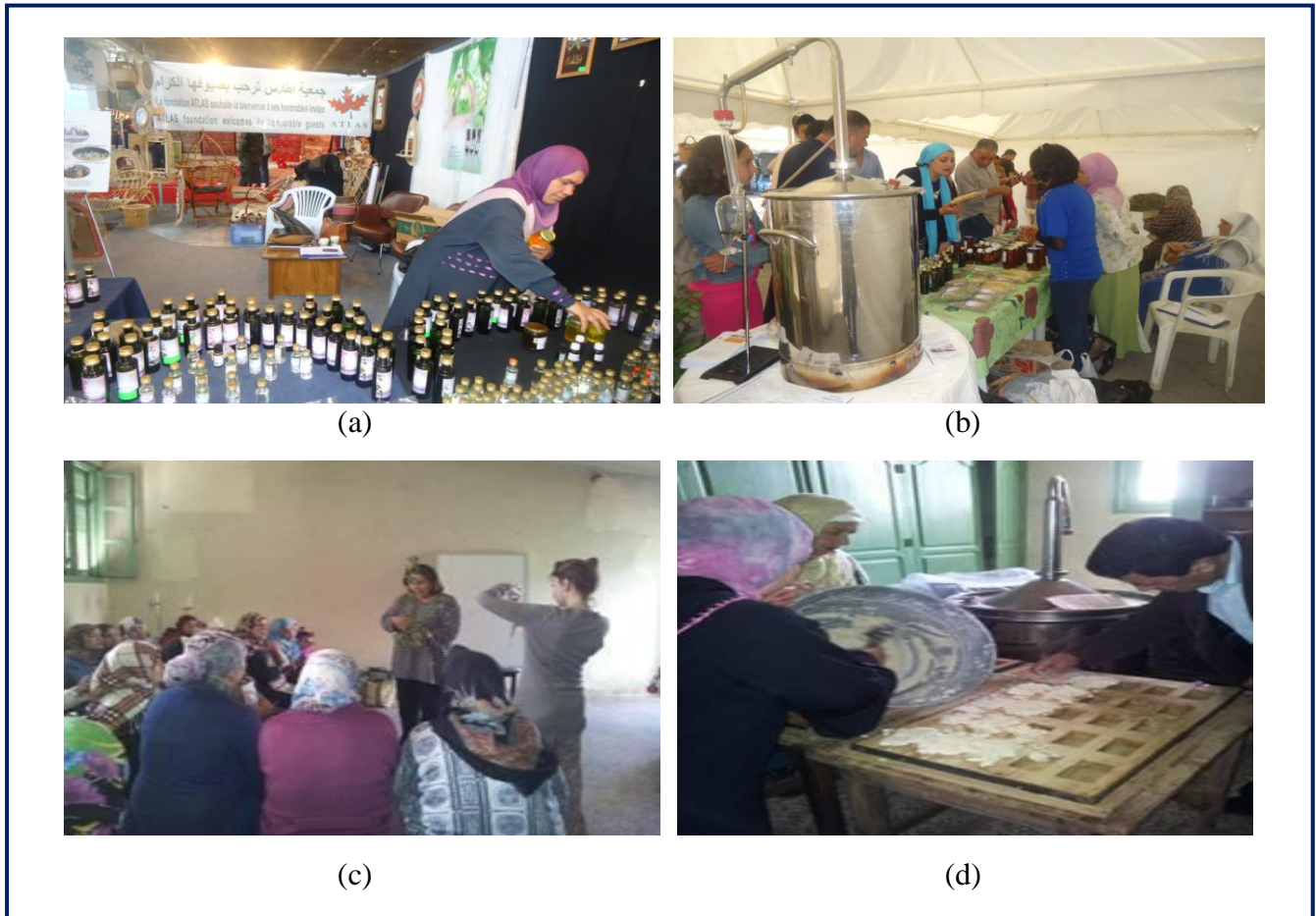
Figure 5. Quelques activités dans le cadre de la coopération ATLAS/GFDA Elbaraka

* (a): Participation à la foire nationale de l'artisanat; (b): Atelier distillation lors du festival de la forêt; (c): Formation en comptabilité et gestion du budget; (d): Formation en saponification