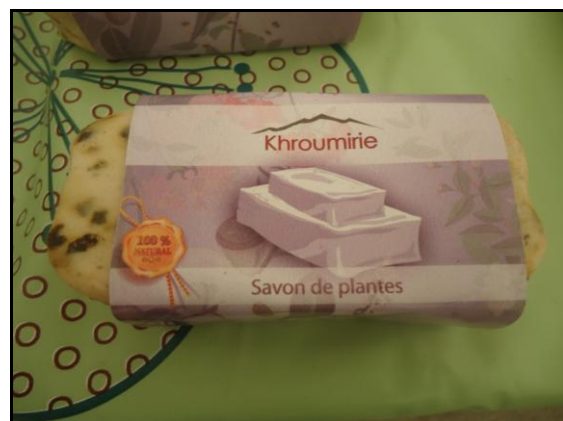
Figure 4. Savon de plantes de la marque Khroumirie

Le GFDA Elbaraka est spécialisé dans la distillation de 12 plantes de la forêt. Il se distingue dans ce contexte des autres GDA spécialisé uniquement dans la distillation d'une ou deux