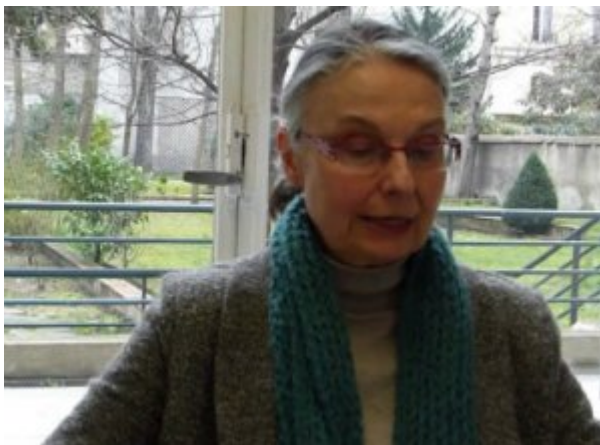
Cynthia Ghorra-Gobin, droits réservés

Aussi si en France le terme mondialisation permet de conduire aisément à une représentation du monde. Il n'en est pas de même pour globalization chez les Anglo-Américains. En suivant le principe du global, les Anglo-Américains font d'abord référence à la révolution numérique autorisant les acteurs (individus ou entreprises) indépendamment de leur localisation géographique de communiquer et de « coordonner leur action en temps réel ». Ce qui représenterait un caractère pratiquement inédit. Globalization évoque