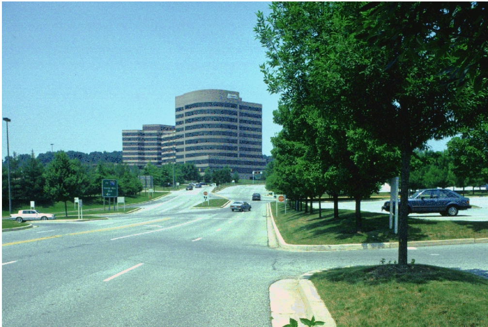
Red Run Blvd. in Owings Mills; note the enormous size of the street and lack of sidewalks. http://www2.iath.virginia.edu/stern/proposal.background.html