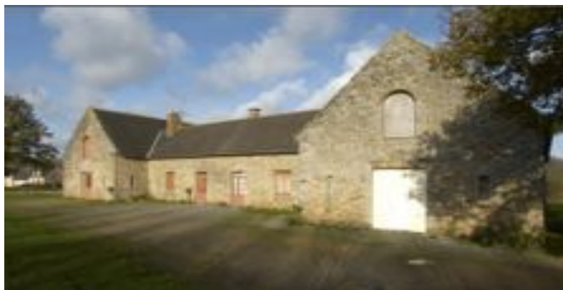
(La ferme de Coueslé)

La rénovation de la ferme de Coueslé, en tant que ferme modèle, constitue, pour le maire, une opportunité pour impulser, à l'échelle de la commune, une dynamique autour du patrimoine : « Un certain nombre de personnes se sont mises en marche » nous précise-t-il. Cet espace présente un potentiel historique pour devenir un lieu de convergence des différents groupes, des diverses activités. Il souhaite ainsi générer une synergie entre son utilisation privée et publique.