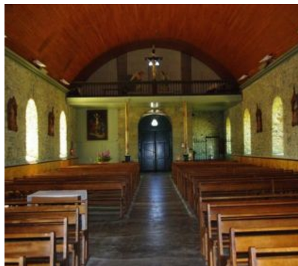
(L'église Saint-Pierre et Saint-Paul de la commune de Bangor)