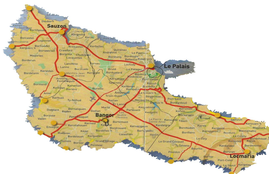
(Situation géographique de Belle-île-en-mer et de la commune de Bangor)