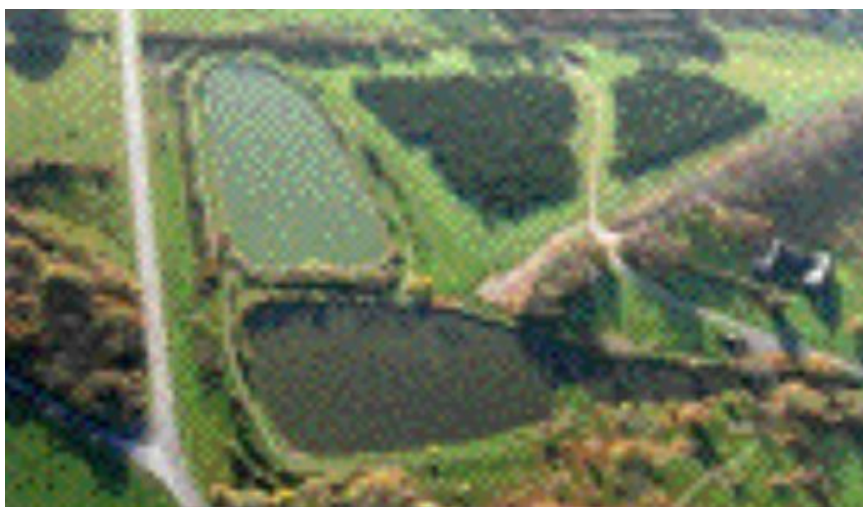
(Le site de Coueslé)

« On est parti de Coueslé, on n'est pas parti de la ferme seulement. Coueslé, c'est plus large. On s'est rendu compte que le manoir et ses terres étaient très étendus ».