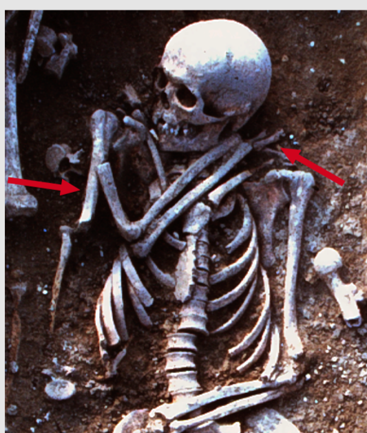
Clichés : F. Blary, 1989.